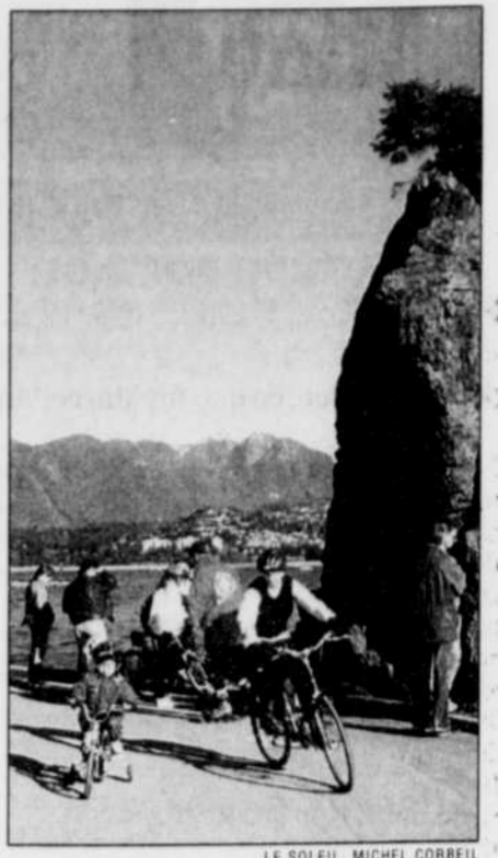
Une portion de Stanley Park.

Pour regarder, comme dirait Prévert, «les belles filles et les vieux cons», les grosses corvettes et les petites motocyclettes.