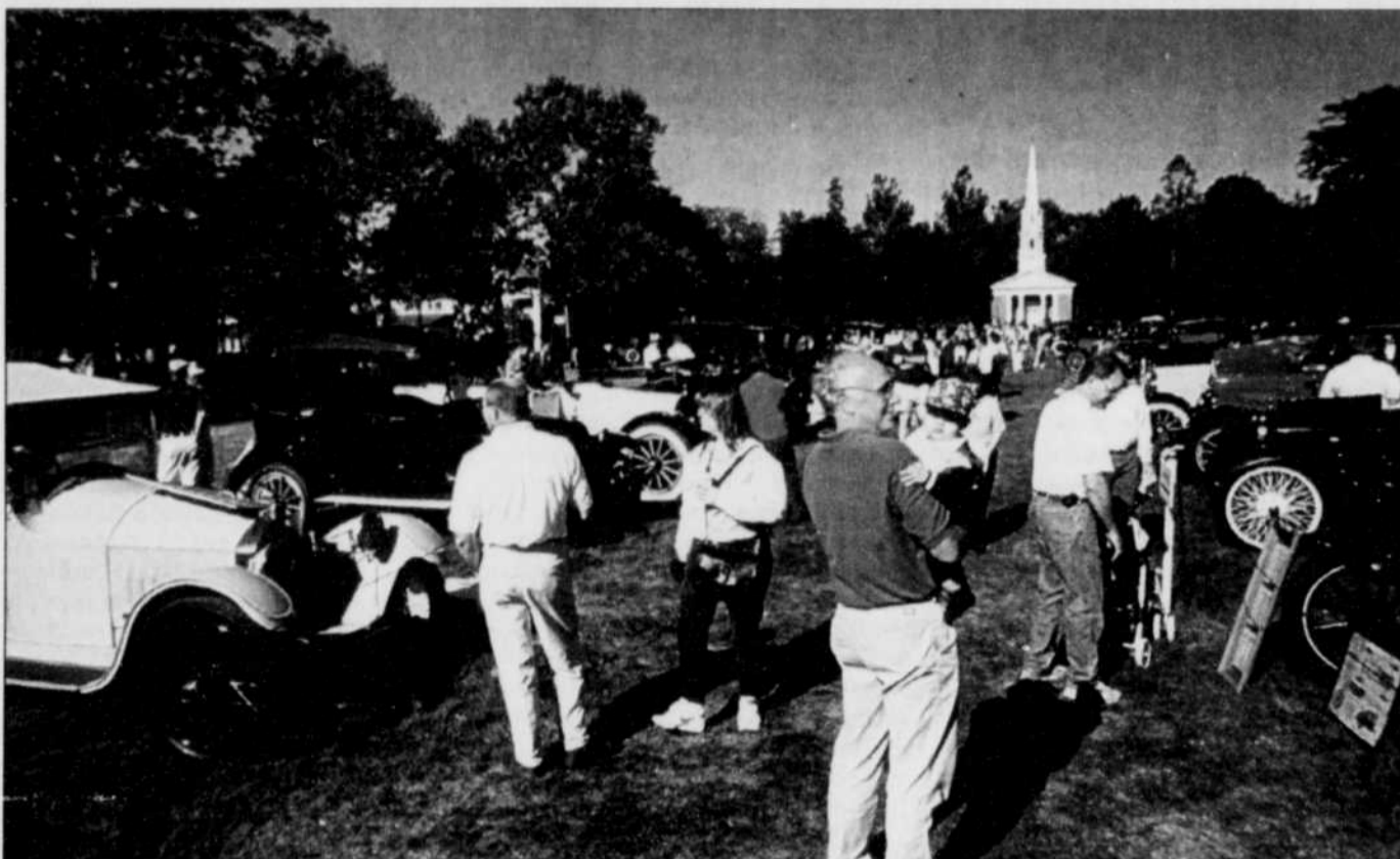
Le festival annuel des vieilles voitures, à Greenfield Village, dans le Michigan, aura une allure spéciale en septembre.

On peut notamment y admirer la dernière des 13 Duryea Motor Wagon construites en 1896. Il s'agissait d'un carrosse sans chevaux mû par un moteur à « gazoline » créé par les frères Charles et Frank Duryea, du Massachusetts. Cette voiture est reconnue comme étant la première sortie d'un atelier de production en Amérique du Nord.