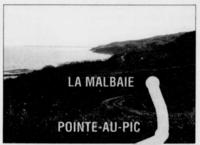
À Cap-aux-Oies, le paysage respire la quiétude.