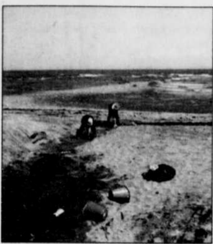
Saint-Irénée l'été, c'est la plage.