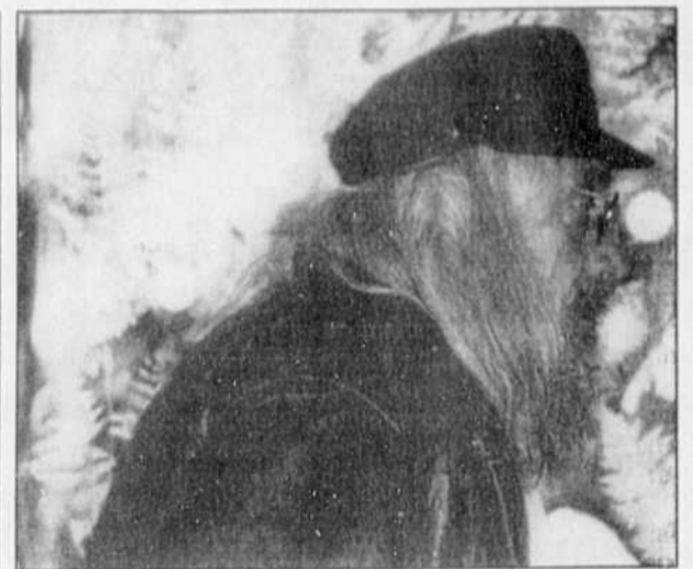
Jean-Paul Riopelle sur fond d'Homage...