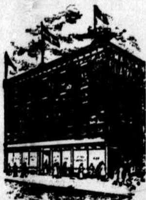
Fondée depuis près d'un demi-siècle