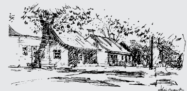
Ma rue raconte... son histoire

Depuis 1981, Boucherville possède une entité responsable de la dénomination des rues. Il s'agit de la Commission de toponymie, qui joue un rôle consultatif auprès du conseil d'arrondissement en recommandant des noms pour identifier les voies de circulation, les lieux et les édifices publics de l'arrondissement.