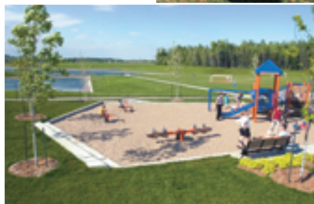
▲ Parc Arthur-Dumouchel