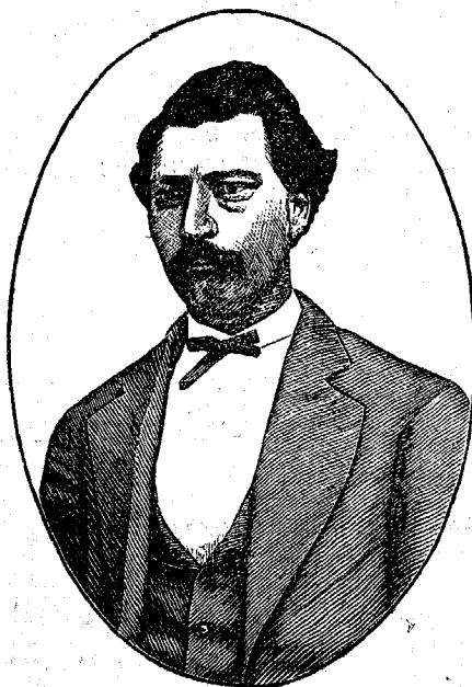
M. LOUIS RIEL.