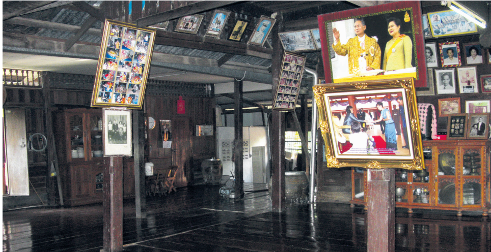
Quelques propriétaires de maisons traditionnelles proposent des visites qui nous renseignent sur leur mode de vie.