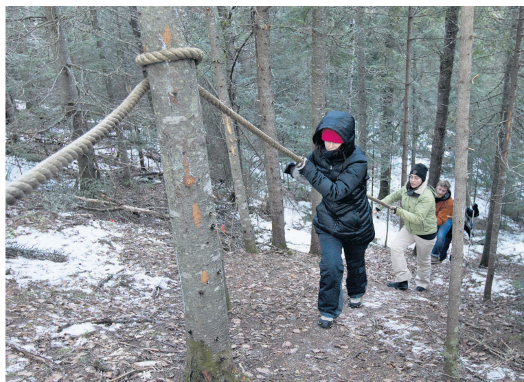
Des cordes ont été installées pour aider les promeneurs dans leur ascension vers le belvédère de la Croix.