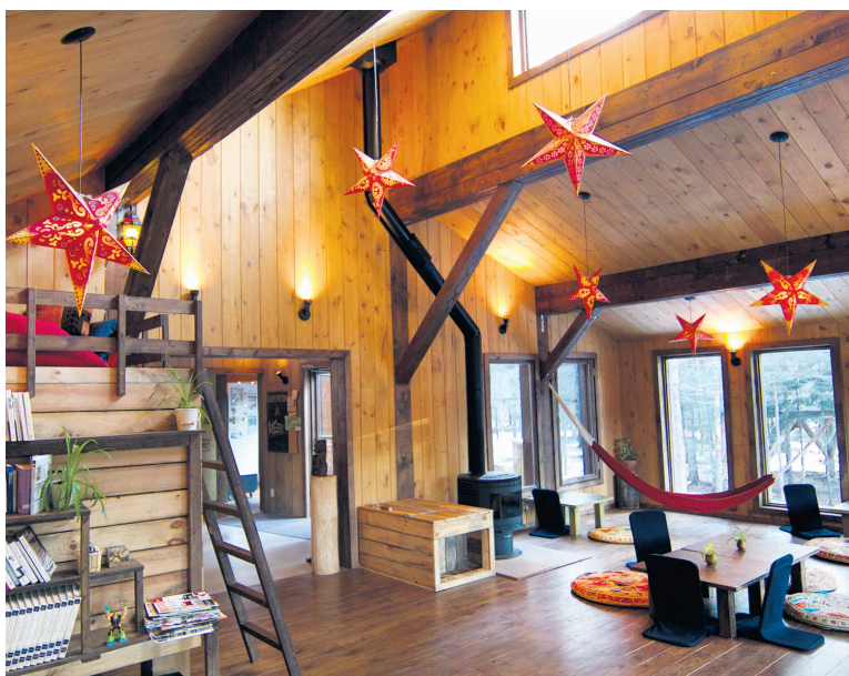
La salle de séjour de la cabane est confortable et lumineuse.