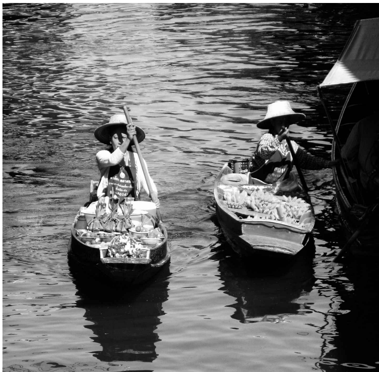
La région de Damnoen Saduak compte plus de 260 canaux.