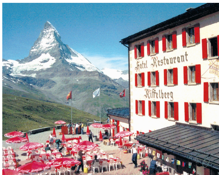
L'Hôtel Riffelberg à Zermatt, en Suisse, avec, en toile de fond, le mont Cervin, la montagne la plus emblématique du pays.