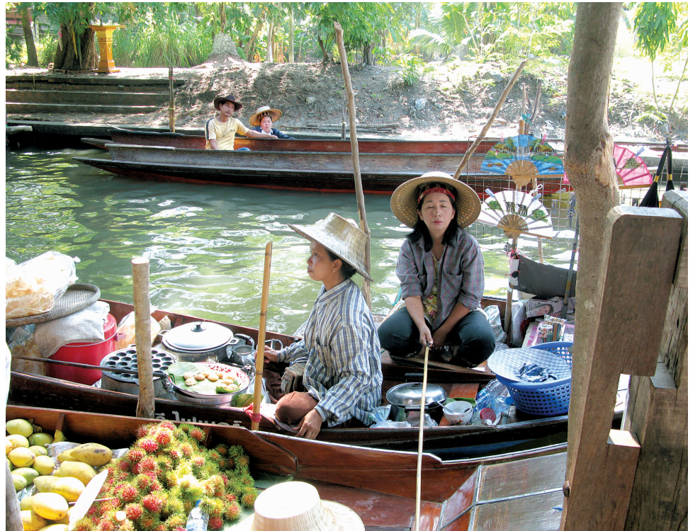
L'ambiance du marché de Damnoen Saduak est très agréable, avec un petit côté exotique. L'ouverture et la patience des vendeurs ajoutent au charme du rassemblement.

Le marché est ouvert du lever du jour jusque vers 13h. Il faut toutefois y aller tôt, avant l'arrivée massive des touristes. Après 11h, le marché perd de son intérêt, les marchands sont fatigués et plusieurs s'en vont préparer les produits qu'ils offriront le lendemain.