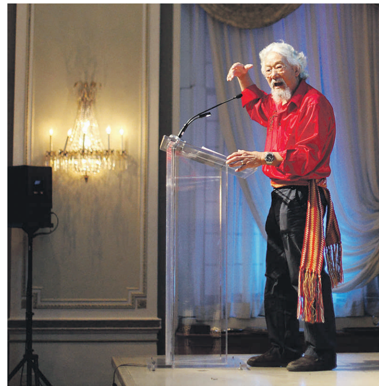
David Suzuki au Château Frontenac

Si l'image du Canada a été ternie à l'échelle internationale, cela ne veut pas dire pour autant que tous les Canadiens sont des pollueurs et qu'ils endossent la politique de leur gouvernement. «À la suite du retrait du Canada de Kyoto, la Fondation a lancé une alerte de mobilisation à tous les Canadiens. En réponse à cette alerte, 16 750 personnes ont envoyé des messages à Stephen Harper,