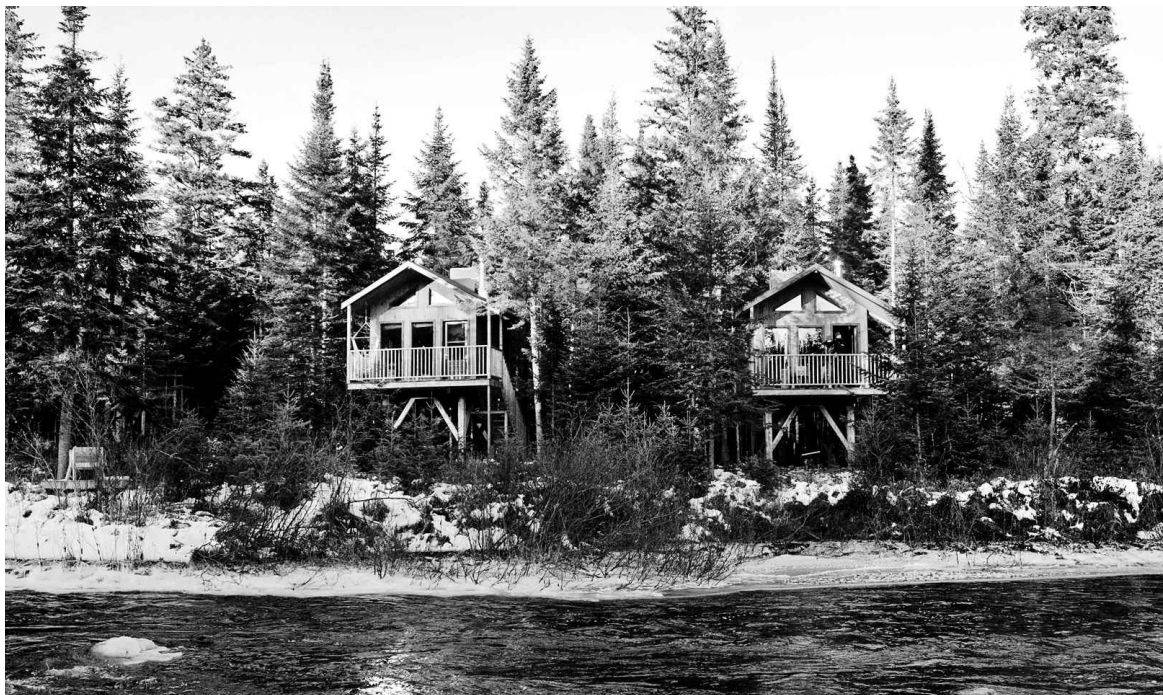
Perchées sur pilotis, neuf maisonnettes, qui forment Kabania à Notre-Dame-de-la-Merci, regardent la rivière Dufresne ou les épinettes de la forêt de la Ouareau.