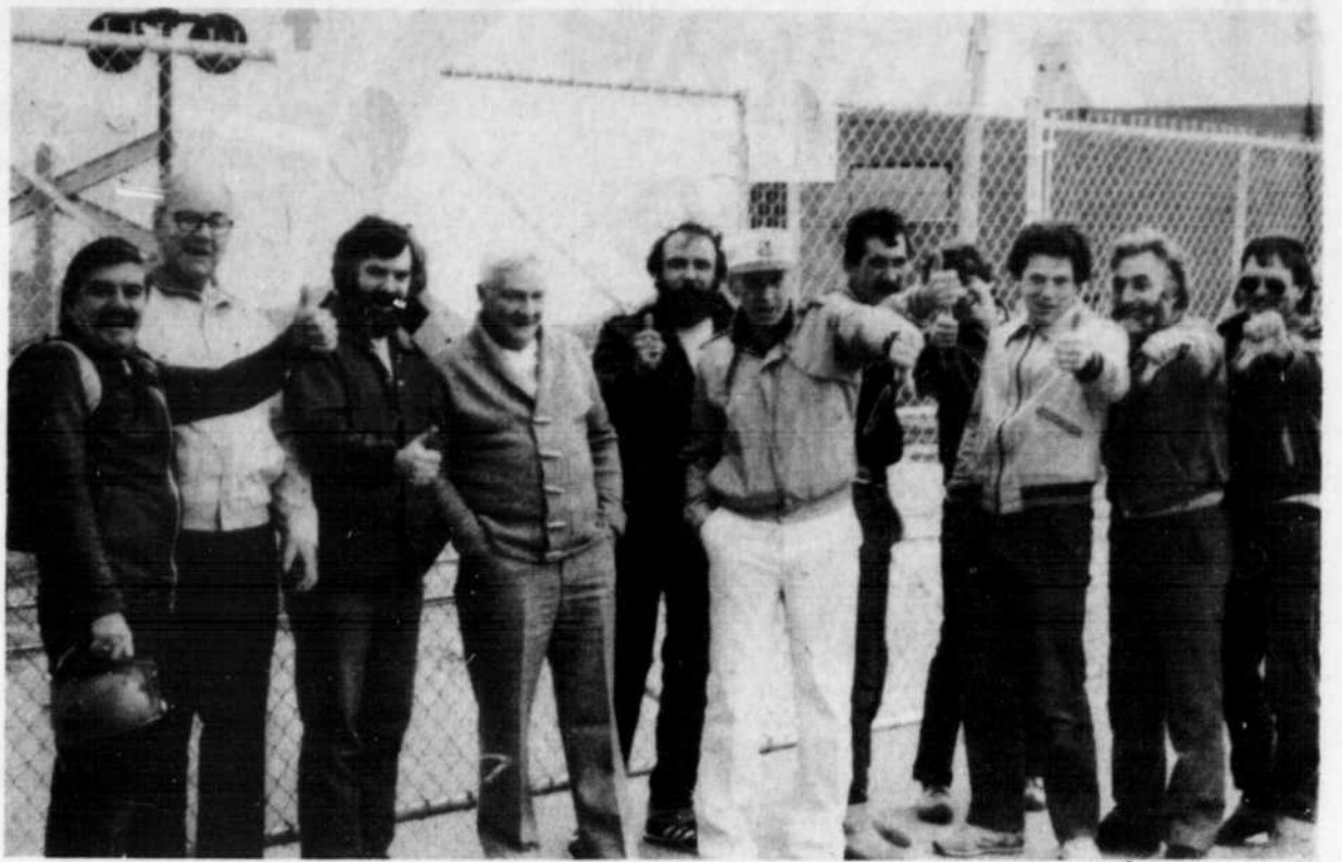
Les syndiqués du local 7285 des Métallos de la compagnie Les Mines d'Amiante Bell Ltée de Thetford, ont dressé une ligne de piquetage devant les installations de la filiale de la SNA.

Rencontrés au bureau des Métallos et sur les lignes de piquetage, plusieurs travailleurs ont clairement laissé entendre qu'ils n'accepteraient aucun recul quant à leur clause d'ancienneté. "Depuis 1980, nous avons toujours été flexibles pour aider la compagnie face à la récession économique. Aujourd'hui, pour nous remercier, la direction veut nous imposer une ancienneté par département alors que nous voulons conserver notre ancienneté globale. Cette fois-ci, il n'est pas question de plier afin d'empêcher l'employeur de faire tout ce qu'il veut avec nous."