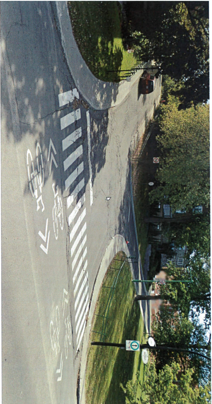
Côte du Vésinet