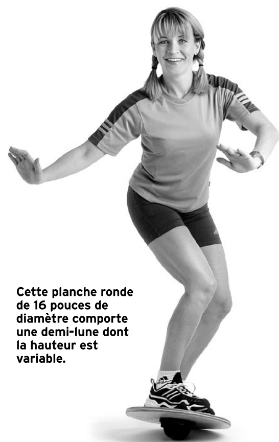
Cette planche ronde de 16 pouces de diamètre comporte une demi-lune dont la hauteur est variable.