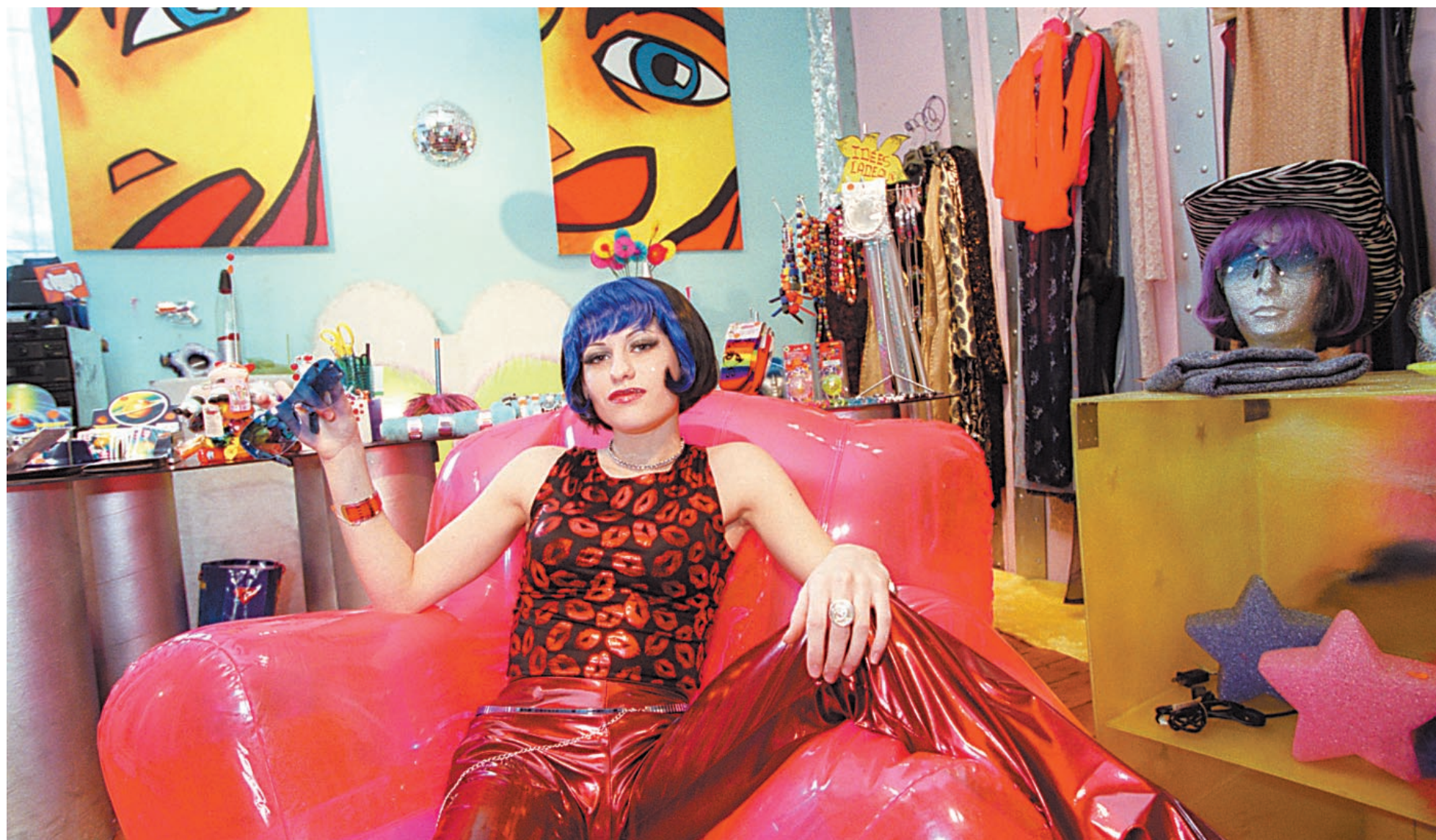
Photos : Rémi Lemière / Michel Gravel / Graphisme : Jocelyne Potelle

Avec leur chanson, Holà décadence , un hymne à la fiesta dont le refrain nous reste accroché dans la tête comme un appel à la folie, le groupe Les Respectables tombe pile! La mode de cette fin de siècle est à l'extravagance. Sortez vos costumes à paillettes, vos fourrures et vos talons aiguilles, laissez-vous aller et entrez dans la danse! Ou dans la décadence?