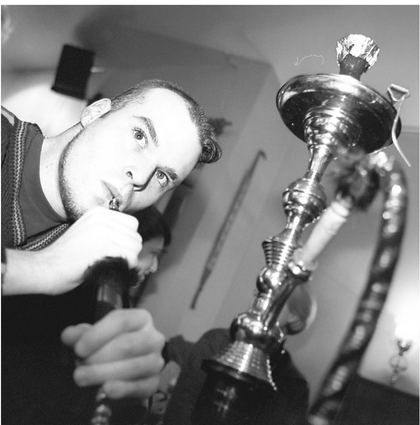
Indra Stream fume un narguilé, une grande pipe à eau orientale dans laquelle on brûle du tabac parfumé à la mélasse, aux fruits ou au miel.