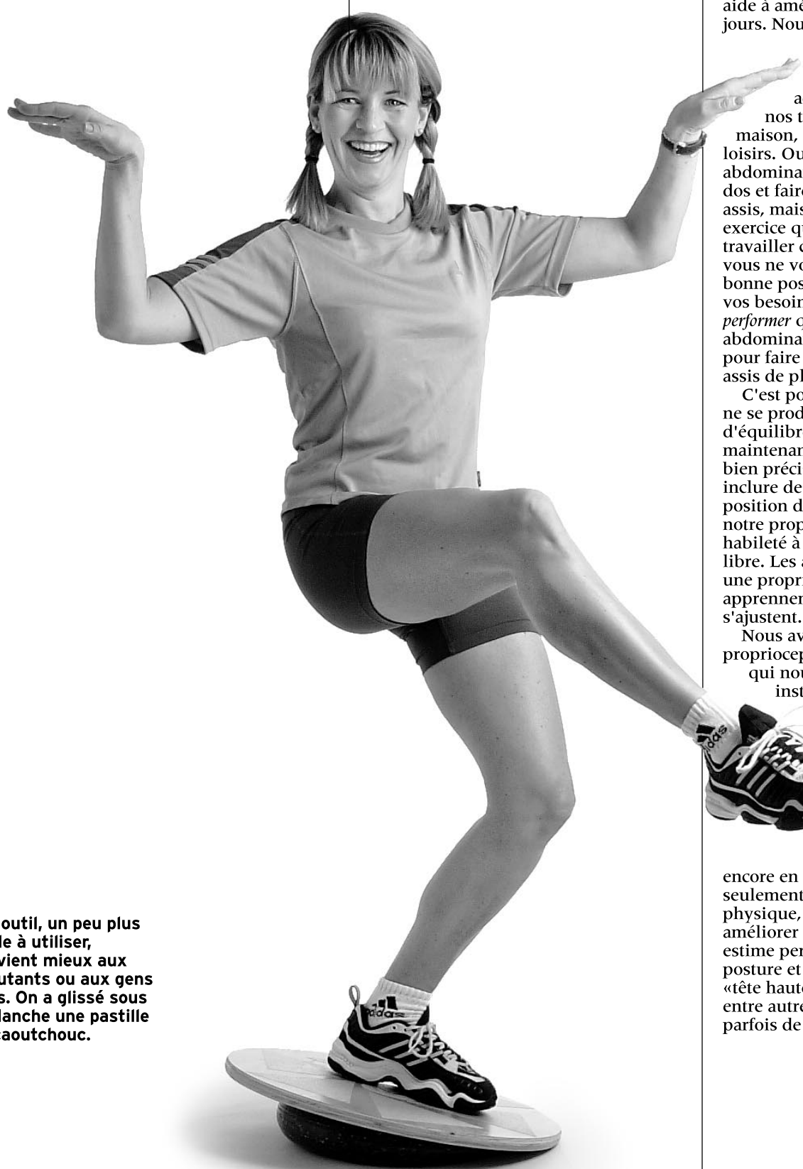
Cet outil, un peu plus facile à utiliser, convient mieux aux débutants ou aux gens âgés. On a glissé sous la planche une pastille de caoutchouc.

Peu importe votre condition physique, si vous faites ce type d'exercices, vous verrez des résultats dans votre vie quotidienne au bout de seulement six semaines... Et je n'ai rien à vendre!