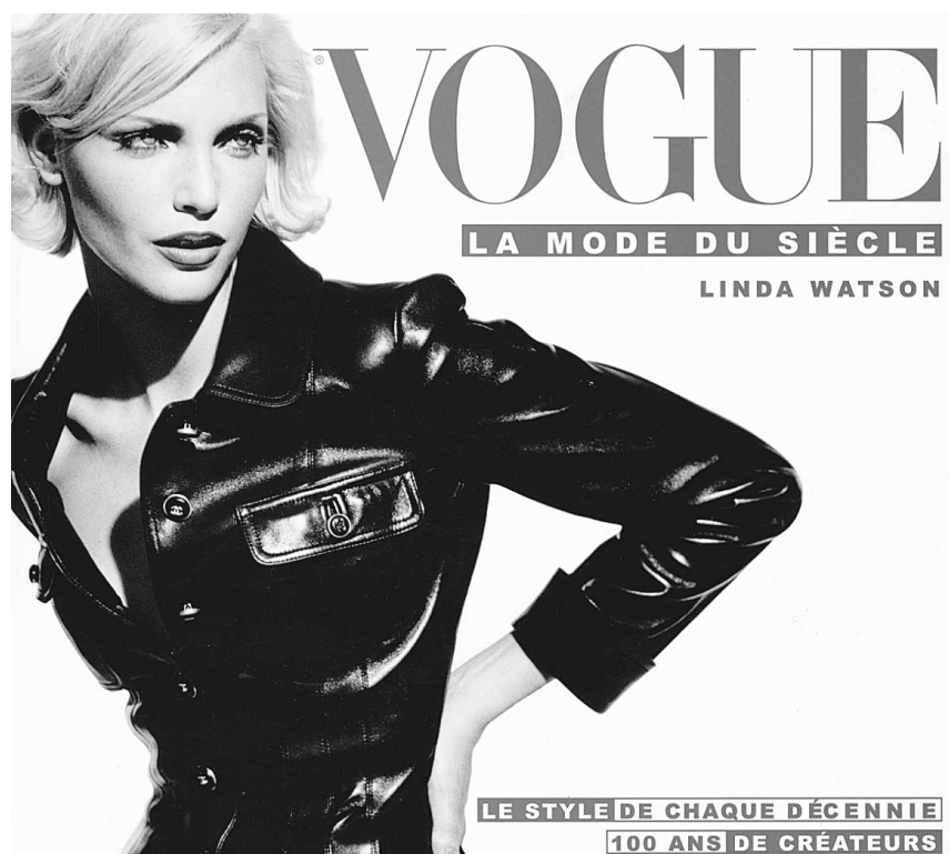
LE STYLE DE CHAQUE DÉCENNIE 100 ANS DE CRÉATEURS