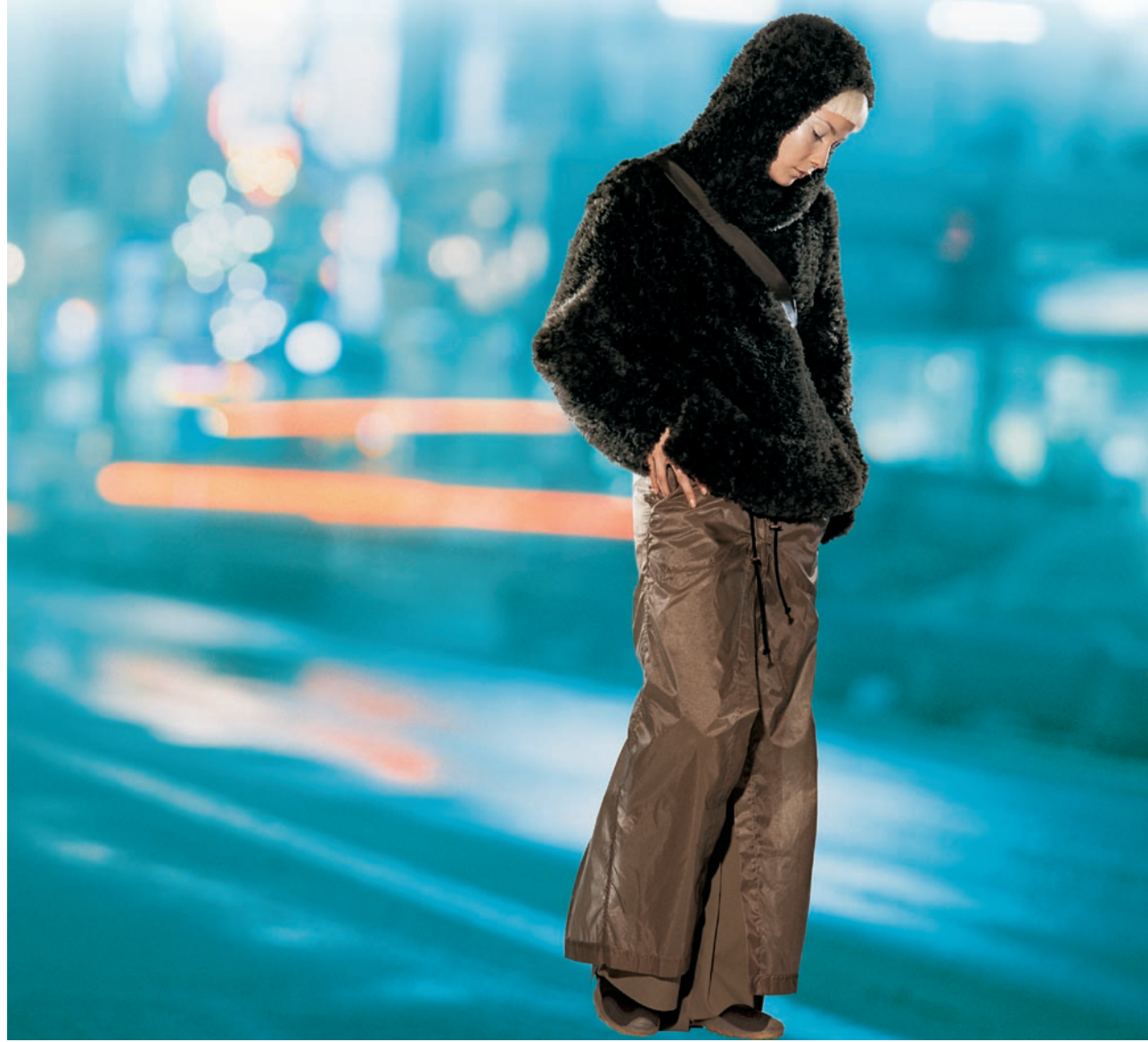
Un manteau tiré de la collection FurWorks Canada en castor tricoté.