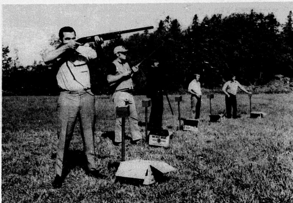
Cinq tireurs du club des Malards de l'île Saint-Ignace ont ouvert officiellement le terrain de tir au pigeon d'argile, dimanche dernier. Voici l'un des tireurs qui s'apprête à tirer.