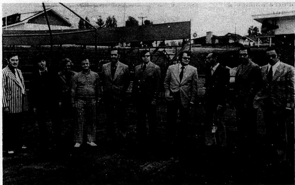
Plusieurs membres de l'organisation du championnat de balle molle, se sont rendus sur le terrain de balle constater sur place le terrain.