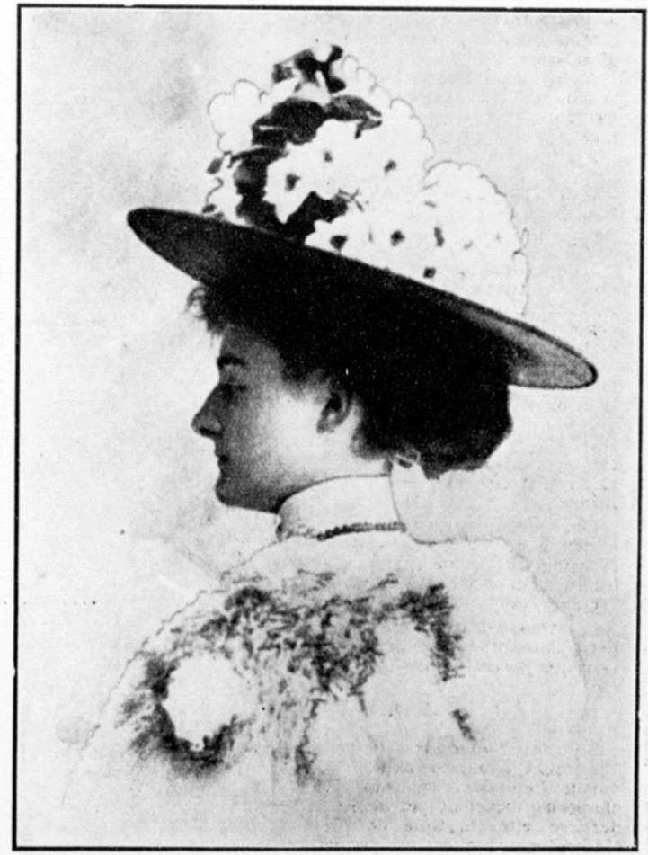
....Oui tout ça c'est pour ma p'tit' Canadienne....