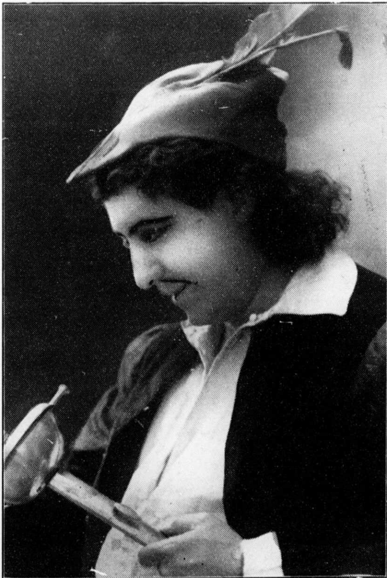
PAUL CAZENEUVE, dans "d'Artagnan"