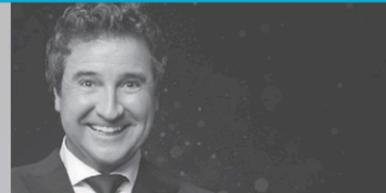
René Simard Nouveau rêve 25 février, 15 h SUPPLÉMENTAIRE