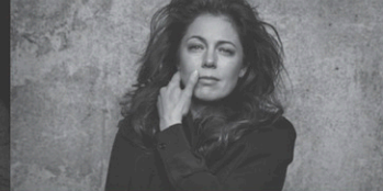
Isabelle Boulay En vérité 9 février