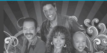
La Compagnie Créole 30 ans de fête au Québec! 28 février