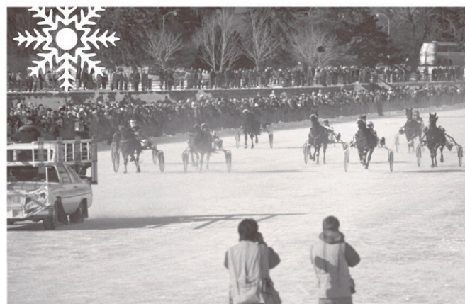
Courses de chevaux sur le Canal (1978).

1982 Le festival tente de battre le record Guinness de la plus longue chaîne humaine. Quelque 17 000 personnes se tiennent la main sur le canal.