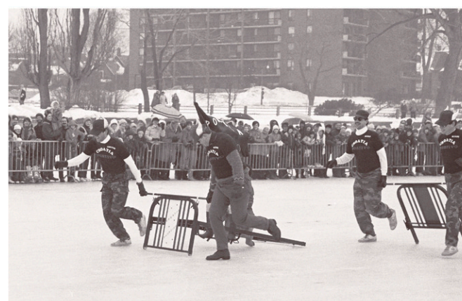
Pas le temps de dormir.