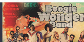
BOOGIE WONDER BAND