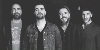
Kaïn Welcome bonheur 7 février

À moins d'avis contraire, les spectacles débutent à 20 h.