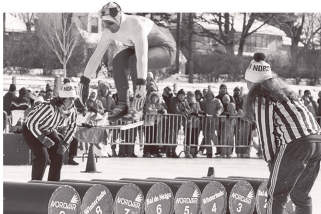
Patinage : saut en longueur.

La création du Bal de Neige s'inspire d'une ancienne tradition. Au XIX e siècle, lorsque l'hiver isolait la région du reste du monde, nos ancêtres avaient coutume de se rassembler pour se divertir en bonne compagnie. Le temps se prêtait aux promenades en carriole, aux tournois de curling, à la glissade en traîneau et au patinage. Quarante ans plus tard, l'idée demeure la même : accueillir la saison froide dans un esprit de communauté et de fête.