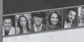
Nos incontournables Mario Pelchat, Natasha St-Pier, Paul Daraïche, Laurence Jalbert, Christian Marc Gendron et Manon Séguin 10 février