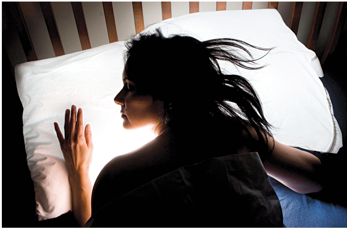
Plusieurs études visant à évaluer l'efficacité de la mélatonine à réduire l'insomnie ont été effectuées, mais elles ont donné des résultats contradictoires.