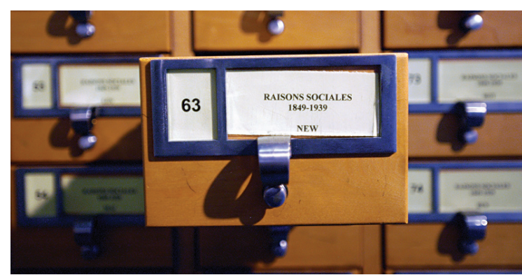
De plus en plus d'archives numérisées circulent sur le Web 2.0.