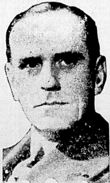
L'HON. ATHANASE DAVID Secrétaire provincial, dans le cabinet Taschereau, notre ministre de l'Instruction Publique.

Quelques chiffres comparatifs suffisent pour donner une idée du développement de l'instruction dans le Québec au cours des 15 dernières années. L'augmentation des inscriptions dans les écoles est caractéristique. En 1920, le nombre des élèves fréquentant les maisons d'enseignement s'élevait à 533,381 au lieu de 672,861 en 1932. Le personnel enseignant, durant la même période, a passé de 19,118 à 26,921 personnes. La progression dans le nombre des écoles s'est accentuée dans le même sens: de 7,706 en 1920, les maisons d'enseignement comprenant les écoles primaires, les collèges, les universités et les écoles spéciales, se sont accrues à 8,602.