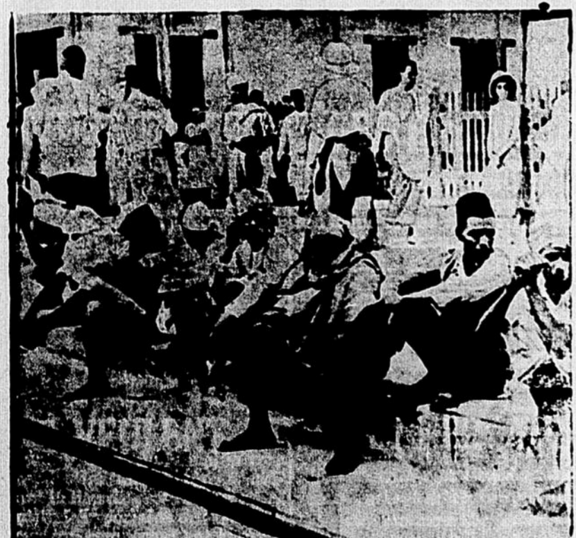
La gare de Djibouti, en Somalie française, très active depuis que le chemin de fer conduisant en Ethiopie est menacé par les Italiens.

Un grand brasseur d'affaires parlant en vacances, recommande à sa dactylographe de faire suivre son courrier. Aux champs depuis huit jours, notre homme s'étonne de n'avoir reçu ni lettres, ni cartes, ni prospectus. Il télégraphie à sa dactylographe: "Pourquoi m'envoyez pas de courrier?" La réponse arrive: "Avez emporté clé boîte aux lettres." En effet, au fond d'une poche, l'homme d'affaires découvre la clé qu'il s'empresse de mettre sous enveloppe et d'ex-pédier. Et il attend. Mais des jours se passent encore sans que la poste lui apporte quoi que ce soit. N'y comprenant plus rien, il reprend le train pour la capitale. Il arrive à son bureau et obtient l'explication du mystère: le facteur avait tout simplement jeté l'enveloppe contenant la clé en question dans la boîte aux lettres... fermée à clé!