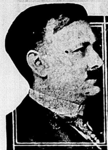
L'HON. HONORÉ MERCIER Ministre des Terres et Forêts dans le cabinet Taschereau.

Comme aux élections provinciales de 1923, 1927 et 1931, des politiciens à responsabilité limitée et de sang mêlé, atteints d'onanisme politique et n'exerçant qu'une influence théorique, cherchent à faire de l'administration forestière, en cette province, une longue histoire de la dilapidation du domaine national, l'aliénation du patrimoine national et le manque de préservation de nos forêts sont le thème. Esprits somnambules, ils semblent avoir perdu toute mémoire du dossier écrasant qui les accable et qu'il importe de rappeler ici.