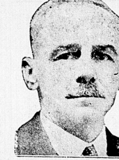
L'HON. C. J. ARCAND Ministre du Travail dans le Cabinet Taschereau.

Cette loi des contrats collectifs de travail est d'une telle importance, qu'un court exposé s'impose ici.