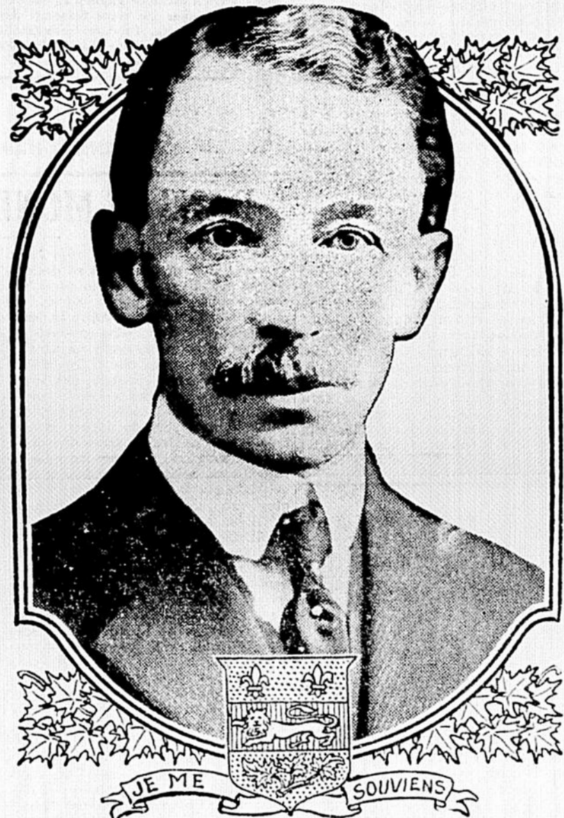
L'HON. ALEXANDRE TASCHEREAU

Ces chiffres furent extraits de rapports publiés par le Bureau Provincial de la Statistique.