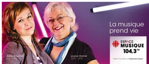
Espace musique contribue à la vitalité culturelle d'ici!