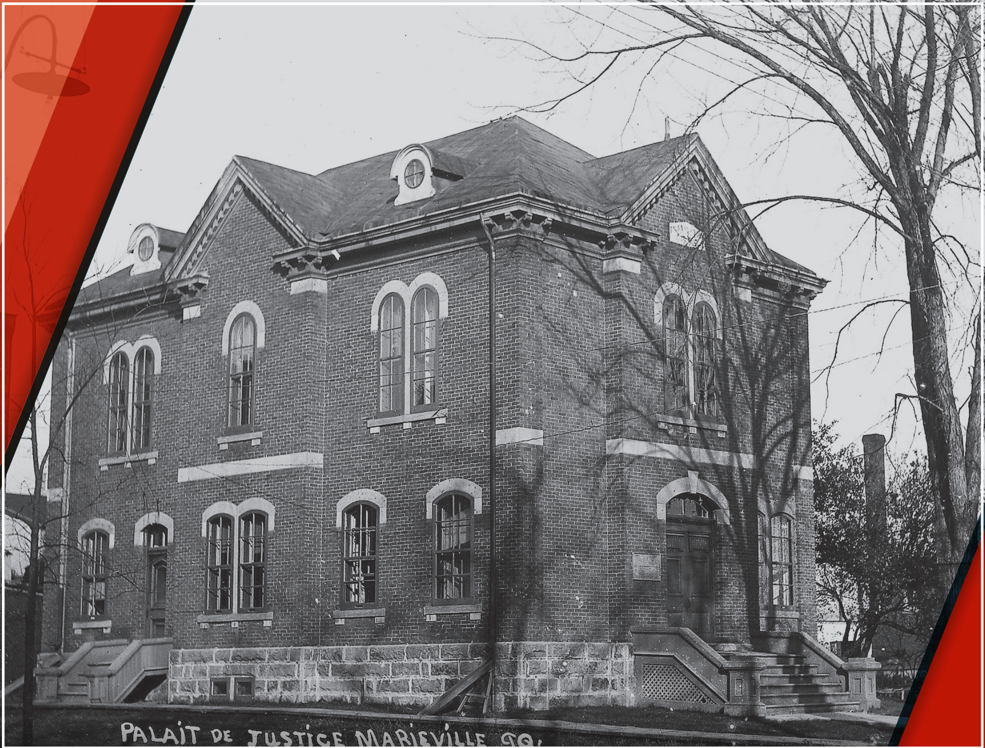
PALAIT DE JUSTICE MARIVILLE Q.C.