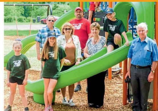
La mairesse de Waterville, Nathalie Dupuis, la députée-ministre Marie-Claude Bibeau ainsi que les conseillers municipaux Karl Hunting et Gordon Barnett sont ici accompagnés de membres de l'Association de balle lente « Wilson Street » lors de l'inauguration du parc Huntingville, tenue le 8 juin dernier.

« Pour avoir des communautés dynamiques, il est important qu'on leur donne des accès à des espaces communs bien équipés et adaptés. Le réaménagement complet du parc Huntingville offre aux citoyens de Waterville un terrain de jeux variés avec des installations accessibles », a mentionné la ministre du Revenu national et députée de Compton-Stanstead, Marie-Claude Bibeau, qui était également présente lors de l'inauguration.