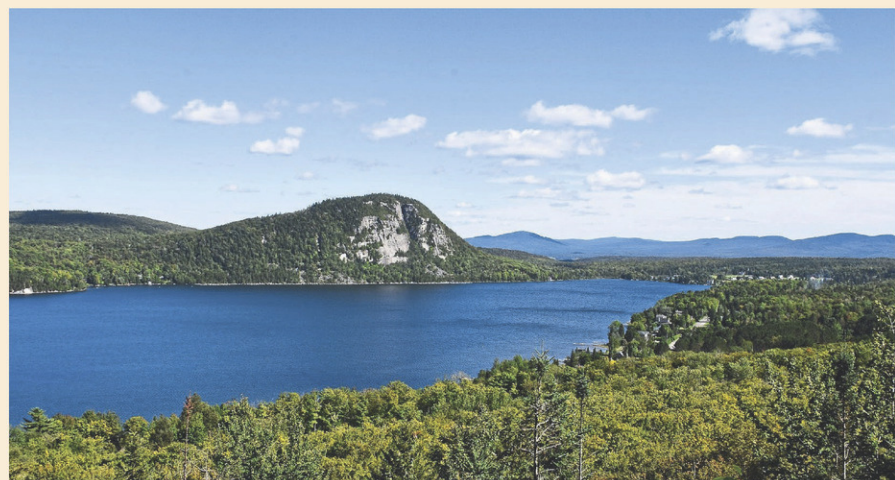
La consultation publique autour de la navigation sur le lac Lyster aura lieu le 28 août.

L'événement se déroulera de 18 h 30 à 20 h 30. Les personnes qui ne peuvent s'y présenter peuvent tout de même donner leur avis en remplissant un sondage en ligne. Celui-ci est disponible sur le site Internet de la Ville de Coaticook.