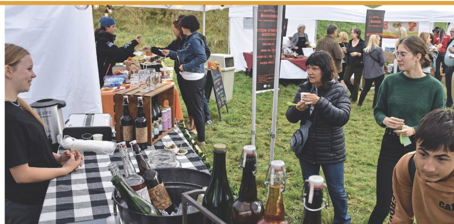
La Virée gourmande des Comptonales aura lieu en octobre prochain, du côté de Compton.

Rappelons que la Virée gourmande des Comptonales aura lieu les 12 et 13 octobre prochains. Près d'une quarantaine d'exposants et de producteurs ont déjà confirmé leur présence à l'événement.