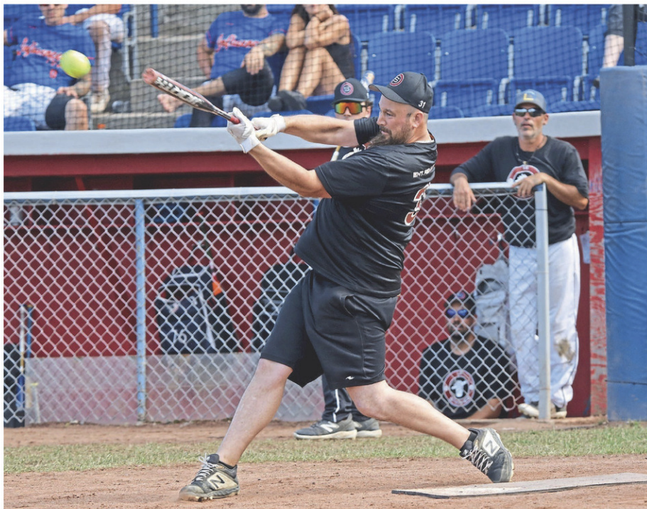
29 équipes seront de la partie lors du cinquième Défi Paul Boutin, lequel aura lieu ce week-end, du 16 au 18 août.