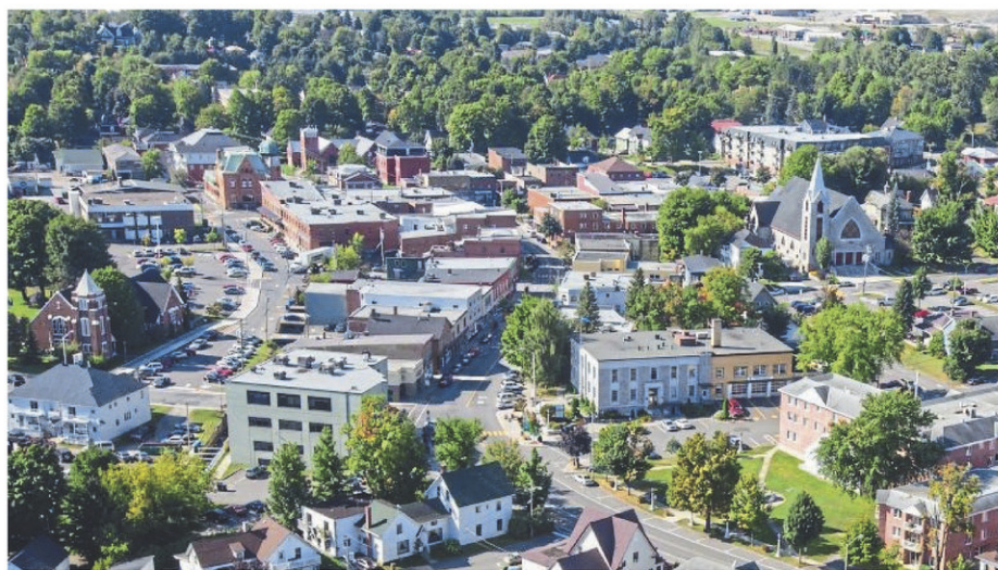
Une vue aérienne de Coaticook.