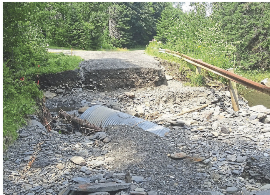
Les travaux de la route 147, en plein cœur de Compton, poussent plusieurs automobilistes à adopter certains comportements jugés dangereux.