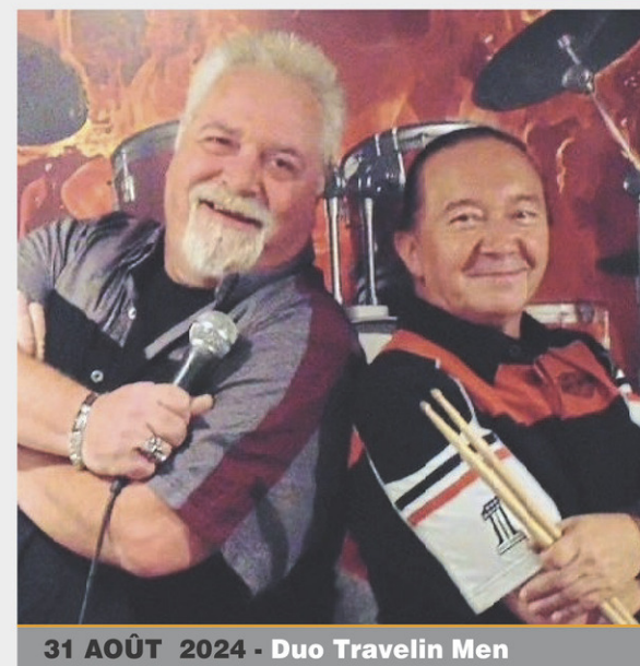
31 AOÛT 2024 - Duo Travelin Men

Saviez-vous que chaque samedi de l'été, le parc offre un spectacle gratuit pour ses campeurs et pour les résidents de la MRC de Coaticook (preuve de résidence requise)? Ces samedis sont des occasions parfaites pour se divertir. Que vous souhaitiez danser ou simplement taper du pied assis confortablement, le plaisir est au rendez-vous!