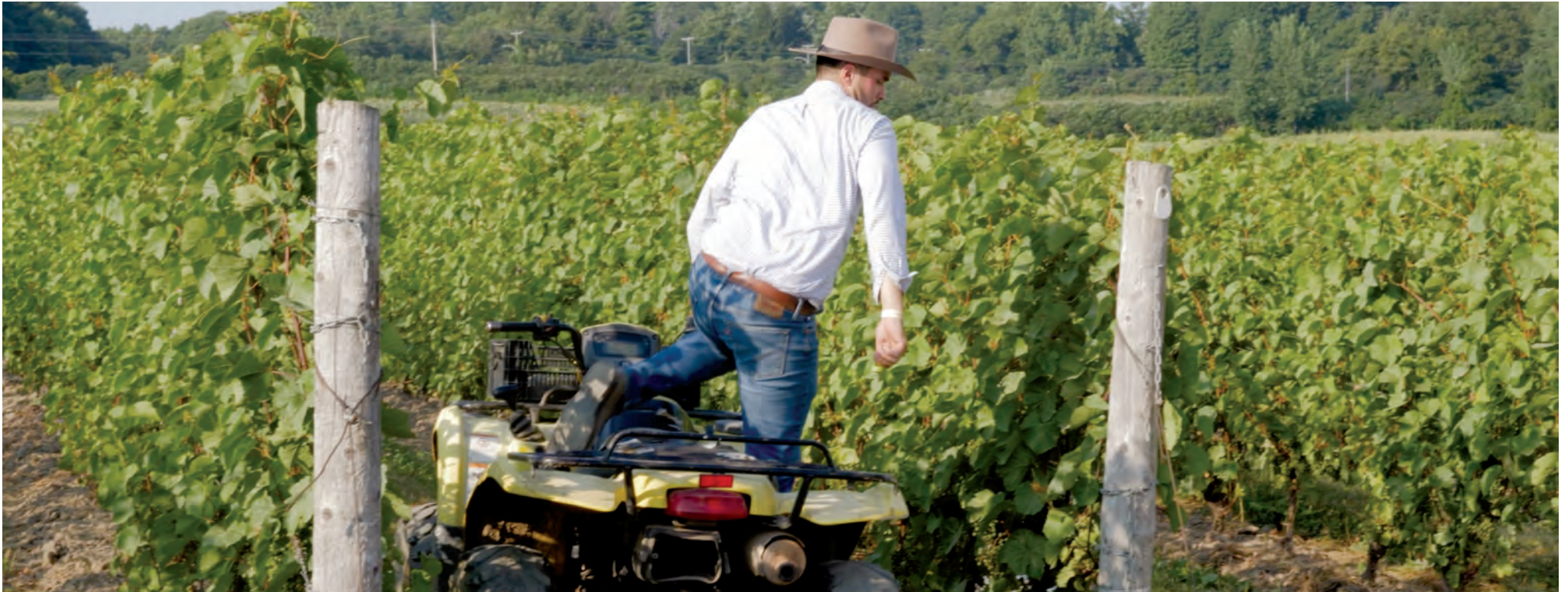
Les coopératives de remplacement agricole sont encore peu implantées dans la région.