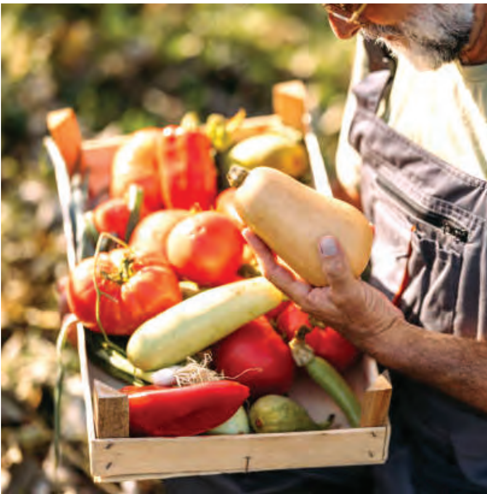
Le Réseau des fermiers de famille met de l'avant un modèle d'agriculture de proximité, où les paniers bio permettent de soutenir directement les fermes locales.

À l'aube de son 30e anniversaire, le Réseau des fermiers et fermières de famille rappelle qu'il est aujourd'hui présenté comme l'un des plus importants réseaux de fermes biologiques au monde, tout en demeurant fidèle à sa mission d'origine : rapprocher les producteurs et les citoyens autour d'une agriculture locale et solidaire.