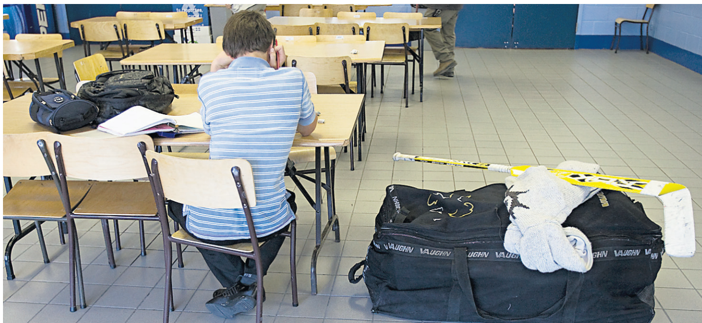
Un dernier devoir à terminer avant de se pointer à la pratique de hockey!

Plus vraisemblablement, la fermeture temporaire du Parlement a plutôt aidé les partis de l'opposition, dont les ténors, libérés de leurs obligations parlementaires, ont parcouru le pays et envahi les ondes. Or, les politiciens sont toujours plus sympathiques en dehors de la Chambre des communes, où la confrontation donne immanquablement lieu à des scènes disgracieuses dont aucun parti ne sort indemne.