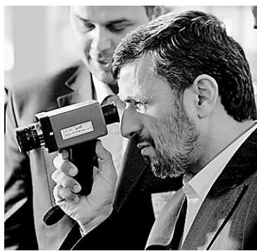
Mahmoud Ahmadinejad

L'Iran a notifié hier à l'Agence internationale de l'énergie atomique sa décision de commencer à produire de l'uranium hautement enrichi (à 20%, à l'usine de Natanz, dans le centre du pays), une mesure condamnée par Paris et Washington qui se sont dits favorables à des «sanctions fortes». AFP