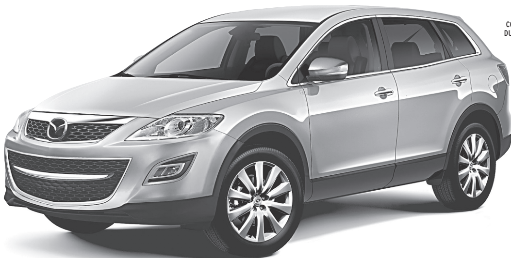
Modèle GT illustré

0,9 % DE FINANCEMENT À L'ACHAT JUSQU'À 60 MOIS †