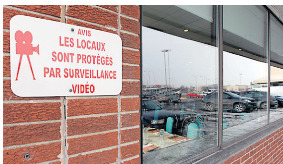
Le Buffet Maison Kirin, à Brossard, a été condamné six fois en 2009.