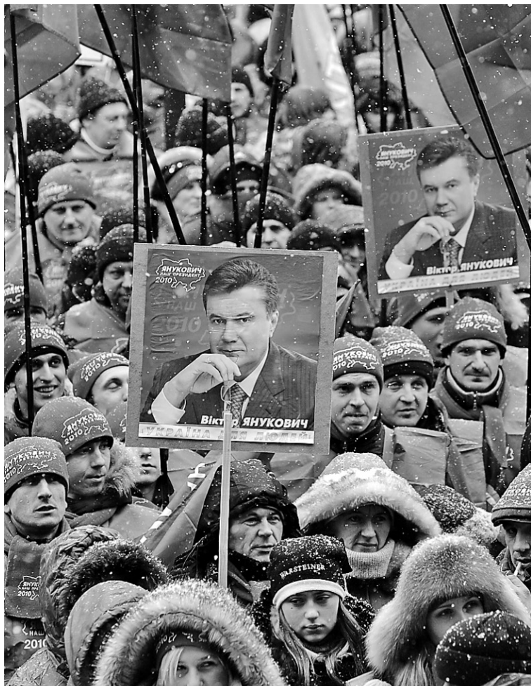
Des partisans du vainqueur de l'élection présidentielle en Ukraine, Viktor Ianoukovitch, se sont rassemblés hier devant les bureaux de la Commission centrale électorale, à Kiev.