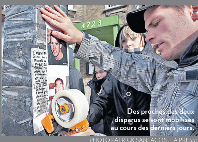
Des proches des deux disparus se sont mobilisés au cours des derniers jours.

Il a mis tout son cœur dans son travail. RÉJEAN TREMBLAY PAGE 5