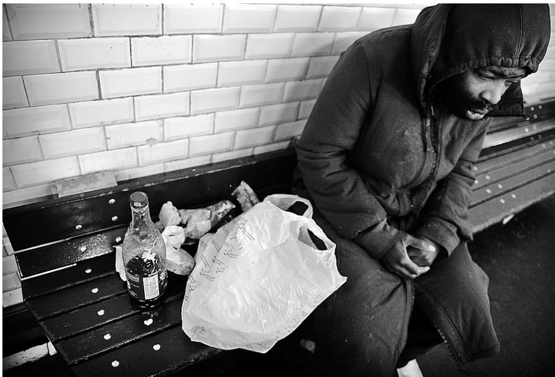
La Fondation Abbé Pierre dénonce l'augmentation des loyers et la construction insuffisante de logements sociaux.