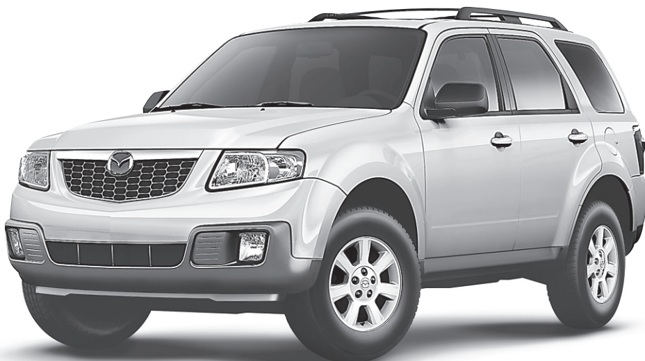
Modèle GT-V6 illustré

0,9 % DE FINANCEMENT À L'ACHAT JUSQU'À 60 MOIS †