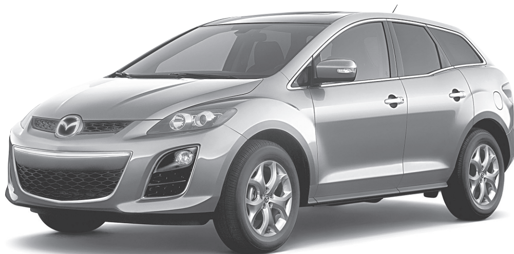
Modèle GT illustré

0,9 % DE FINANCEMENT À L'ACHAT JUSQU'À 60 MOIS †