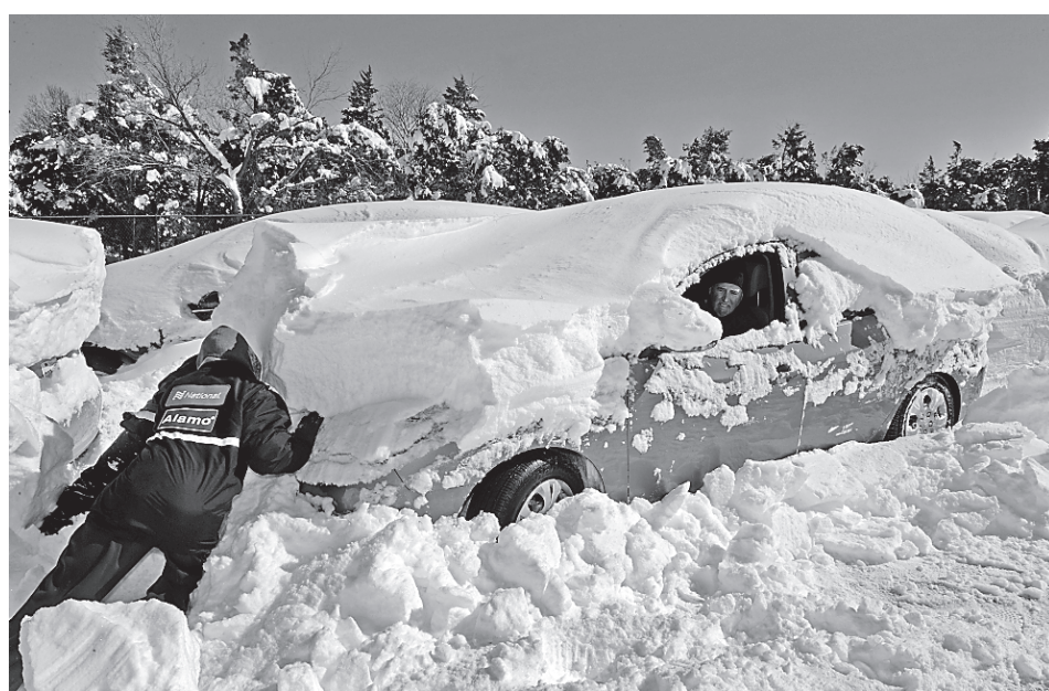
Des employés d'une agence de location d'autos travaillaient à dégager les véhicules embourbés hier à l'aéroport international de Dulles, qui dessert Washington.

Ses deux prédécesseurs, Paul Cellucci et David Wilkins, nommés par George W. Bush, n'avaient pas hésité à critiquer vivement le gouvernement canadien lorsqu'il avait pris des positions divergentes de celles de l'administration américaine, comme dans le cas de la guerre en Irak.