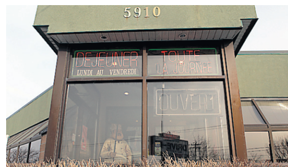
Le restaurant Québec Drive-In, à Saint-Hubert, champion des infractions en 2009.