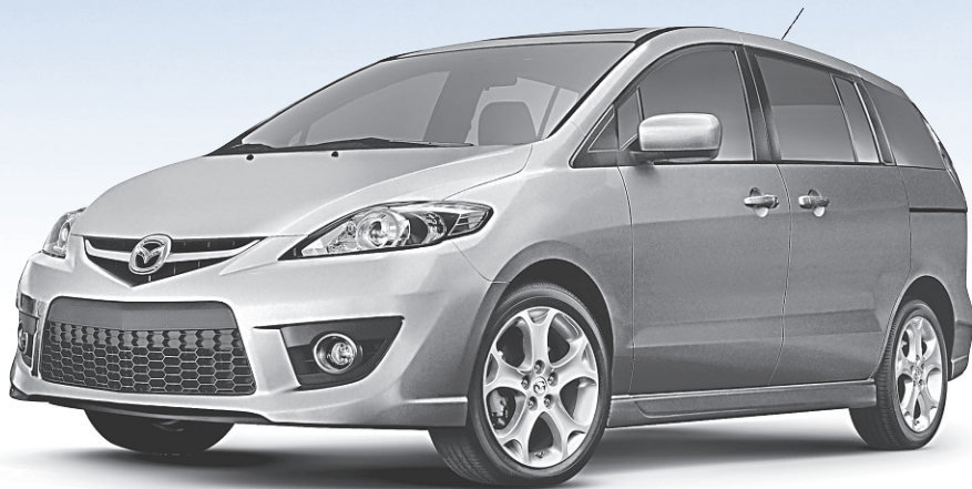
Modèle GT illustré

★★★★★ COTE DE SÉCURITÉ LA PLUS ÉLEVÉE DU GOUVERNEMENT DES ÉTATS-UNIS LORS D'ESSAIS DE COLLISION*