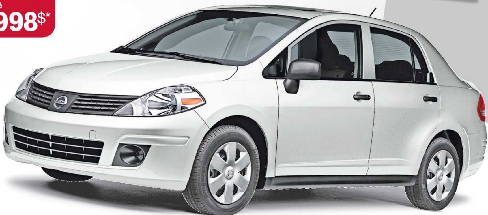
Versa berline 1.6 S illustrée

VISITEZ VOTRE CONCESSIONNAIRE NISSAN DÈS AUJOURD'HUI, OUVERT JUSQU'À 21H LES SOIRS DE SEMAINE** nissan.ca