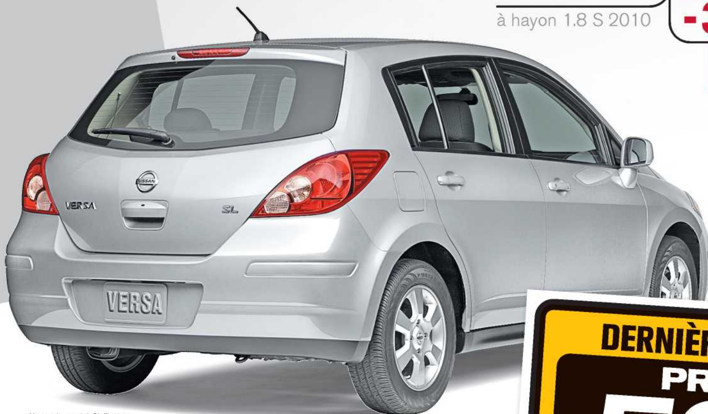
Versa à hayon 1.8 SL illustrée

PLUS QUE JAMAIS UNE NISSAN C'EST LE TEMPS DE CHOISIR 2010