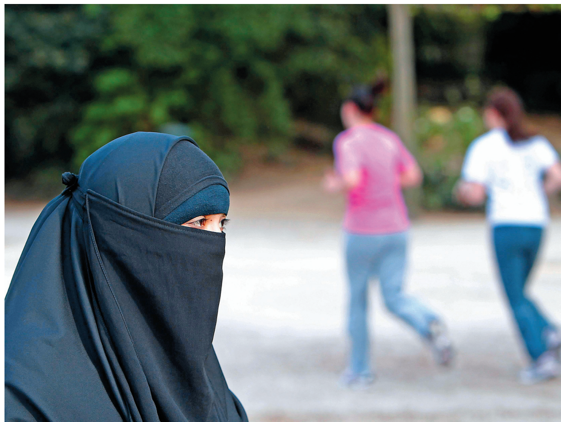
La quasi-totalité des Québécois (95 %) et la très grande majorité des Canadiens (86 %) se sont déclarés favorables à l'interdiction du voile intégral.

L'un des obstacles les plus sérieux au déve-