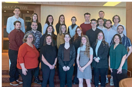
Vingt-trois étudiants du Cégep Beauce-Appalaches ont participé à ce déjeuner d'affaires immersif.

« Ce type de mise en situation permet aux étudiants de vivre une expérience concrète de négociation en plus de perfectionner leur langage des