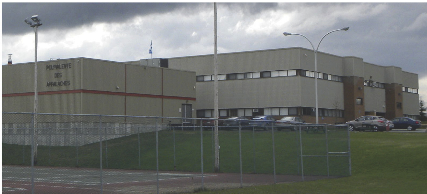
Des travaux d'amélioration seront apportés aux systèmes de chauffage et de ventilation de l'école des Appalaches.

Cela amènera automatiquement des travaux visant à renforcer la toiture de l'école des Appalaches et la direction du CSSBE procédera également au remplacement des chauffe-eau et du réservoir d'expansion, équipements datant de 1972, ainsi qu'au changement de tous les luminaires extérieurs qui seront remplacés par un