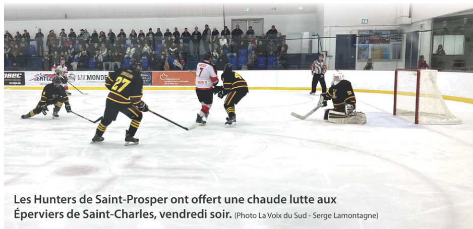
Les Hunters de Saint-Prosper ont offert une chaude lutte aux Éperviers de Saint-Charles, vendredi soir.

À la lumière du sondage, il semble qu'en général, la cohabitation des usages avec le milieu agricole sur le territoire de la MRC Beauce-centre se porte bien quoique les efforts de sensibilisation au sujet des odeurs doivent être faits en continu. On remarque une légère hausse du taux de problématiques de cohabitation soulevées par rapport à des résultats obtenus lors d'un sondage du même type fait en 2018. Le projet « Cohabitation sécuritaire en milieu agricole » visait à faire de la sensibilisation autour des enjeux concernant l'agriculture en utilisant différentes approches pour rejoindre la population et les producteurs. La compréhension mutuelle entre les producteurs agricoles et les autres résidents, entre ruraux et néoruraux peut se traduire par de petits changements de comportement qui parfois, feront la différence pour une amélioration de la qualité de vie pour tous.