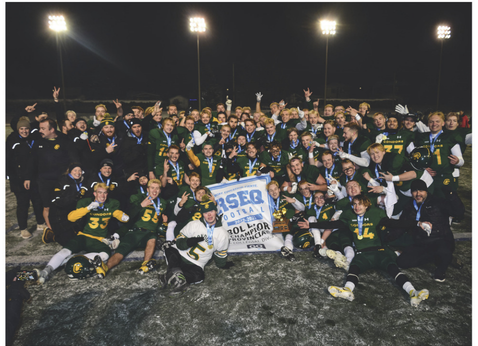
Les Condors ont détruit le Bol d'or après leur victoire en finale le 19 novembre dernier.

« Nous sommes satisfaits de pouvoir enfin mettre un point final à ce regrettable événement. Nous souhaitons laisser derrière nous un événement malheureux et désirons désormais aller de l'avant, relever les défis qui se présentent à nous, entre autres avec la promotion en Division 2 et l'accès aux séries éliminatoires pour nos Condors », conclut la directrice générale du CBA.