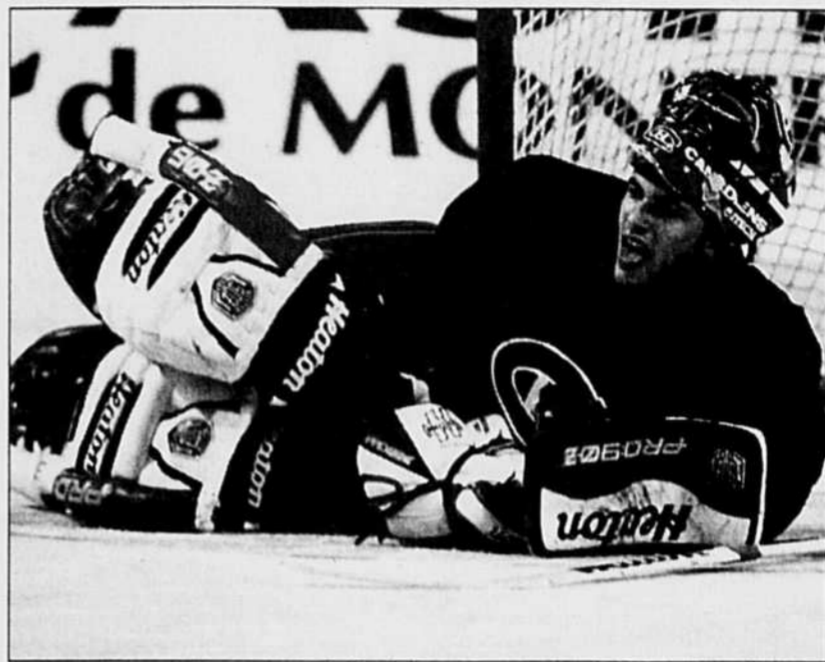
José Théodore peut souffler: il conserve la confiance de Vigneault.

«Enfin, il y a la qualité des gardiens, de conclure Linden. Il y en a de bons dans tous les clubs et il arrive qu'un gardien gagne un match à lui seul.»