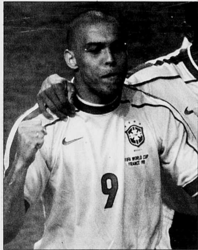
Ronaldo lors de la Coupe du monde 1998.

Paris — Ronaldo espère que l'opération pratiquée hier à Paris par un pont de la chirurgie traumatique constituera la dernière étape d'un feuilleton médico-sportif qui éloignait l'ancien meilleur joueur du monde du haut niveau depuis seize mois, depuis sa funeste finale du Mondial 1998 avec le Brésil contre la France à Paris.