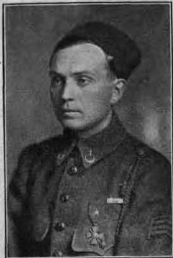
Cliché d'Albert Dumas, 249 Ste-Catherine Est M. Gaston Charles