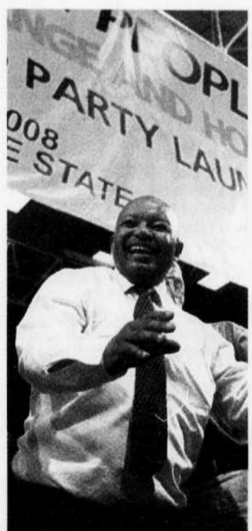
RIAN HORN REUTERS