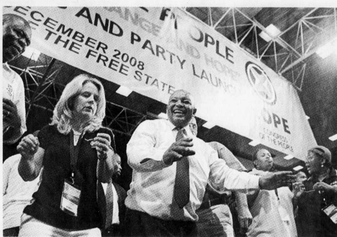
Mosiuoa Lekota a célébré sa nomination avec des partisans hier.

« Nous avons appris de nos erreurs ces 15 dernières années, plus particulièrement dans la manière dont nous avons, jusqu'à un certain point, négligé le peuple du fait d'avoir été si concentrés sur la gou-