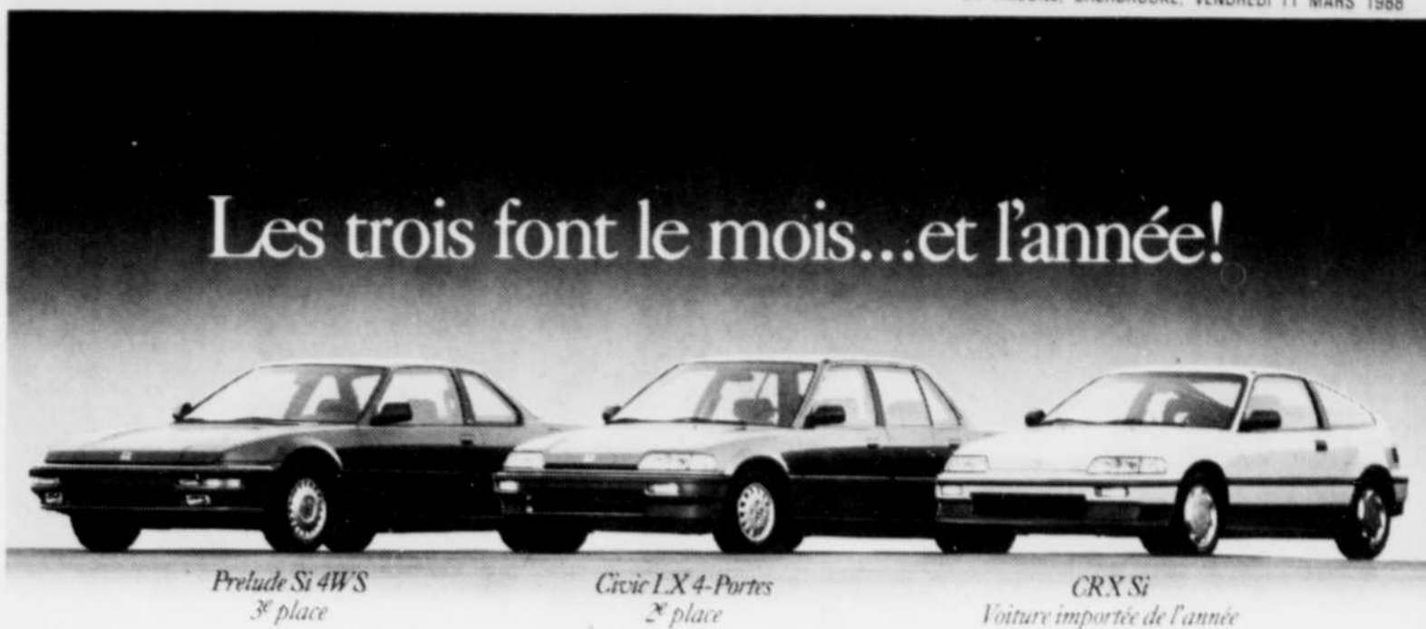
Prelude Si 4WS 3 e place

Si l'acquisition du Droit par le groupe Hollinger, en juin 1987, a suscité des inquiétudes quant au respect de la vocation première du journal, estime-t-il, elle a aussi été une source d'espoir pour les journalistes qui espéraient une relance de l'unique quotidien francophone de la capitale fédérale.