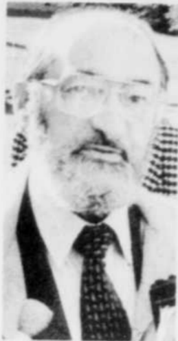
Dr Henry Morgentaler

TORONTO (PC) — Bill Vander Zalm n'est pas apte à être premier ministre d'une province pluraliste et démocratique, affirme le docteur Henry Morgentaler dans un télégramme où il réclame, du même souffle, des excuses publiques de la part du premier ministre de la Colombie-Britannique. Le médecin montréalais n'a pas apprécié les propos tenus plus tôt cette semaine à son sujet par le premier ministre Vander Zalm. "Nous n'allons pas payer pour que le docteur Morgentaler et