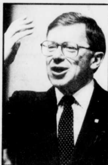
Gérard-D. Lévesque, ministre des Finances.

tions aux services passés des régimes de retraite des employés du secteur public.