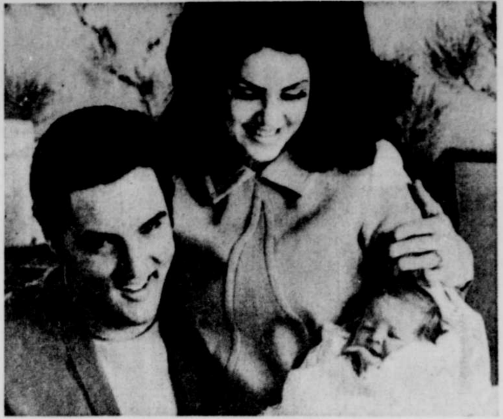
LE CELEBRE CHANTEUR ELVIS PRESLEY et sa femme posent sur notre photo avec leur nouveau-né. Il s'agit d'une fille nommée Lisa-Marie. C'est le premier enfant du roi du Rock'n Roll qui s'est marié il y a quelques années.