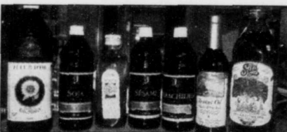
Les huiles de première pression à froid (dont celles de maïs, soya et tournesol) sont les meilleures sources de vitamine E.