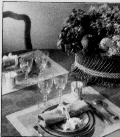
Ambiance idéale ? La chaleureuse quiétude d'un restaurant ou l'intimité duvetée de votre salle à manger...

Imaginons un instant une soirée type de Saint-Valentin. La chaleureuse quiétude d'un restaurant ou l'intimité duvetée de notre salle à manger, des lumières tamisées, un Sinatra et des violons qui roucoulent en sourdine, le vin au frais, les regards de velours, tout y est ! L'heure est à la déclaration ou la confirmation de notre flamme, de notre passion, voici venu le jour de l'année où, plus que tout autre, se murmurent les paroles les plus douces, les plus envoûtantes qui nous emmèneront, on l'espère bien, dans un voyage jusqu'au bout de la