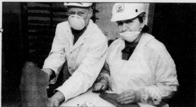
Le fumage d'un poisson exige 21 opérations différentes chez Grizzly.

Rares sont les boucaniers dans la région de Québec. En fait, seulement deux ou trois entreprises se spécialisent dans le « fumage »; le fumoir Grizzly à Québec, La Fée des grèves, sur la Côte de Beaupré, et le fumoir des pêcheries Gingras, à Saint-Nicolas. C'est peu, compte tenu que l'on dénombre 1200 fumoires industriels au Canada.