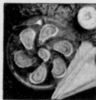
L'huître est l'aliment le plus reconnu comme tel.

De nombreux aliments ont la réputation d'avoir des pouvoirs aphrodisiaques. Même si l'on n'a pas vraiment de preuves tangibles à ce sujet, le fait d'être convaincu qu'un aliment est aphrodisiaque peut suffire pour qu'il le devienne. Si le cœur vous en dit, étendons-nous sur le sujet (hum!). L'huître, par exemple, est certainement l'aliment le plus reconnu comme tel. Sa teneur en protéines, fer, calcium, magnésium, potassium, iode et vitamines peut certainement prédisposer aux ébats amoureux. Le caviar, les escargots et les truffes ont également la réputation d'aliments hautement aphrodisiaques. Certains aliments sont plutôt suggestifs par leur forme, leur texture, ou la sensualité qui en émerge. Pensons aux artichauts, asperges, carottes, ainsi qu'aux fraises, aux dattes, aux abricots et pêches.