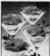
Les fraises : sensuelles de forme et de couleur.