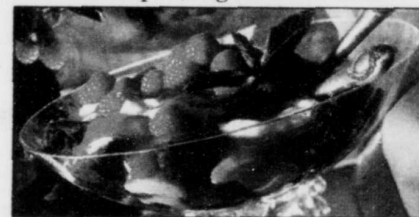
Coupe de fruits et crème, riche et sensuel.

Le raffinement d'un repas qui stimule tous les sens a de quoi mettre dans tous leurs états les amoureux... Voici à ce sujet ce qu'en dit l'Encyclopédie Britannica: «La combinaison de différentes réactions sensorielles—la satisfaction visuelle du spectacle d'aliments appétissants, la stimulation olfactive de leurs agréables parfums et la gratification tactile fournie à la bouche par de riches et savoureux plats—tend à amener un état général d'euphorie favorable à l'expression sexuelle». Il est donc de mise de célébrer l'amour autour d'un repas soigné et succulent.