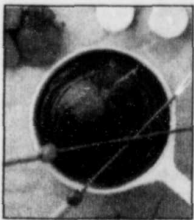
La fondue au chocolat: un délicieux dessert.