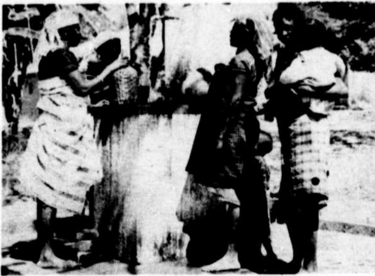
En Afrique, les dames que nous voyons ici vont participer à la journée mondiale de prière. Elles sont doublement heureuses de le faire cette année, puisque ce sont elles qui ont préparé les prières et les chants pour toutes les femmes du monde.