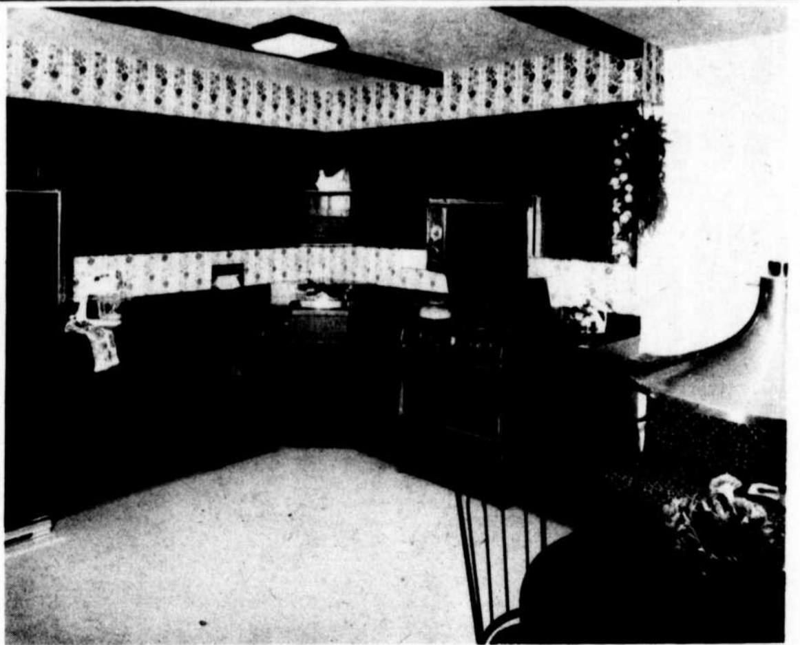
Cet élégant ensemble Cuisine/Salle de séjour plaira à tous les membres de votre famille. Les comptoirs et armoires sont recouverts d'un lamellé ARBORITE motif noyer facile d'entretien, rappelant les tons des meubles figurant dans le coin d'entrée et repos.