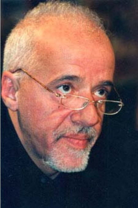
Paulo Coelho

L'auteur Paulo Coelho vient de publier un recueil de 101 textes qu'il avait écrit au cours des ans: