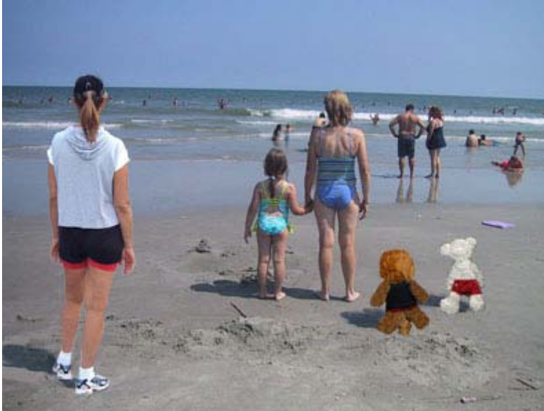
mademoiselle X, ses mascottes ourson athlète et monsieur x et sa «Famiglia» (Jo et Caro) sur une plage américaine.

«Il faut choisir, dans la vie, entre gagner de l'argent ou le dépenser. On n'a pas le temps de faire les deux!»