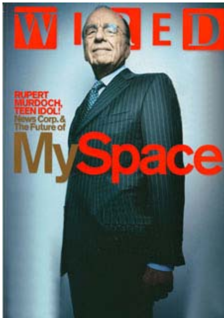
Rupert Murdoch

Le propriétaire de l'entreprise de presse News Corporation, Rupert Murdoch, est convaincu que l'internet doit être comparé à l'imprimerie il y a 500 ans.