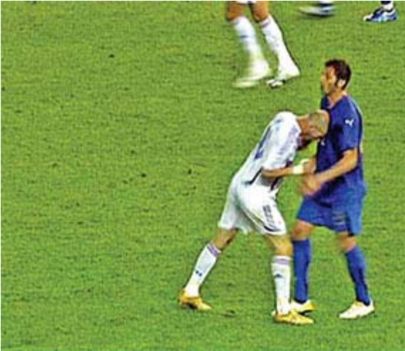
Zidane et Materazzi

La secteur de la télévision connaît une période d'interrogation sur le plan de sa rentabilité et de sa vocation. Mais ce média domine encore nos habitudes de vie.