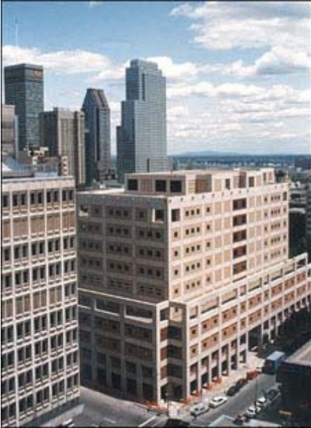
Université Concordia Campus centre-ville à Montréal

La question n'est plus: Êtes-vous compétent mais êtes-vous admiré? L'Université Concordia a été aux prises la semaine dernière avec la gestion de l'information identifiant le présumé terroriste libanais Assem Hammoud, 31 ans, comme un diplômé de l'institution. La Banque Nationale du Canada a fait face à la même situation car l'accusé y a travaillé quelques mois. Le dévoilement de ce genre d'information est toujours critique pour l'entreprise car la perception est plus importante en société que la réalité. «Ce que l'on voit en public ne représente que 10% de la réalité mais les décisions importantes sont prises sur la perception...» Un article du Wall Street Journal confirme cette situation!