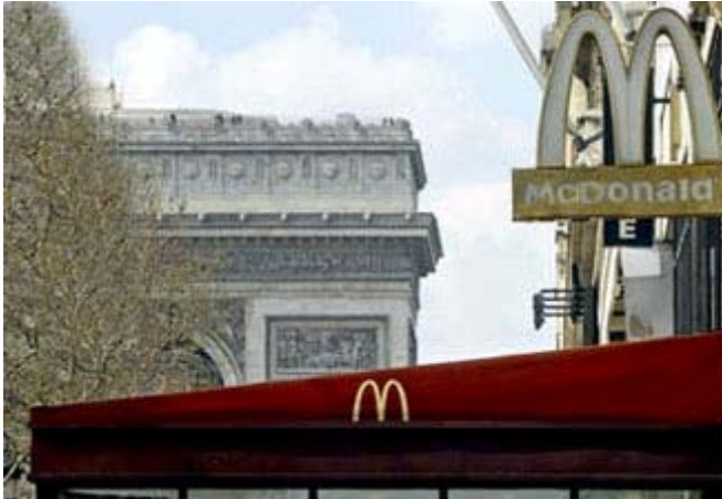
Restaurant McDonald Champs-Élysées - Paris