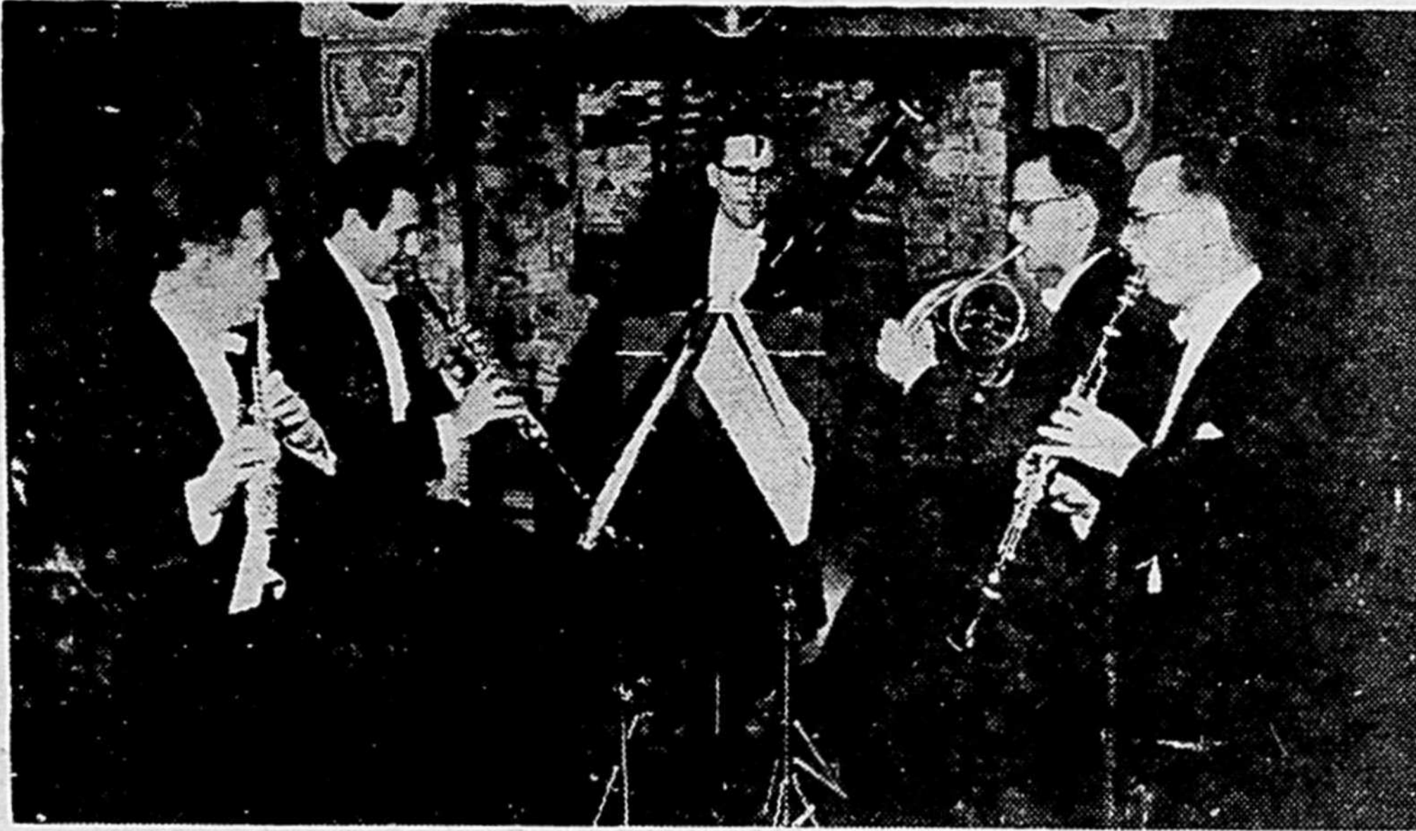
PROCHAIN CONCERT J.M.C.

C'est le Quintette Eichendorf qui donnera le prochain concert en soirée des Jeunesses Musicales. Il s'agit d'un quintette à vent: flûte, clarinette, hautbois, basson et cor français. Les instrumentistes de l'ensemble font tous partie du Tonkünstler-Orchester de Vienne. L'ensemble