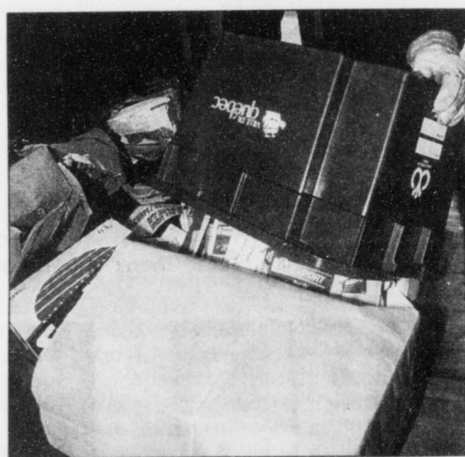
Manque de temps, d'équipement... Les compagnies de recyclage invoquent plusieurs raisons pour se justifier de ne pas récupérer les cartons de lait.

Sainte-Julie, considérée comme une ville très verte, veut même aller encore plus loin. « D'ici cinq ans, on devrait avoir trois types de collectes: les déchets normaux, la cueillette sélective et les déchets de cour », affirme Marcel L'Homme. Il avance également qu'une cueillette de déchets domestiques dangereux pourrait voir le jour.