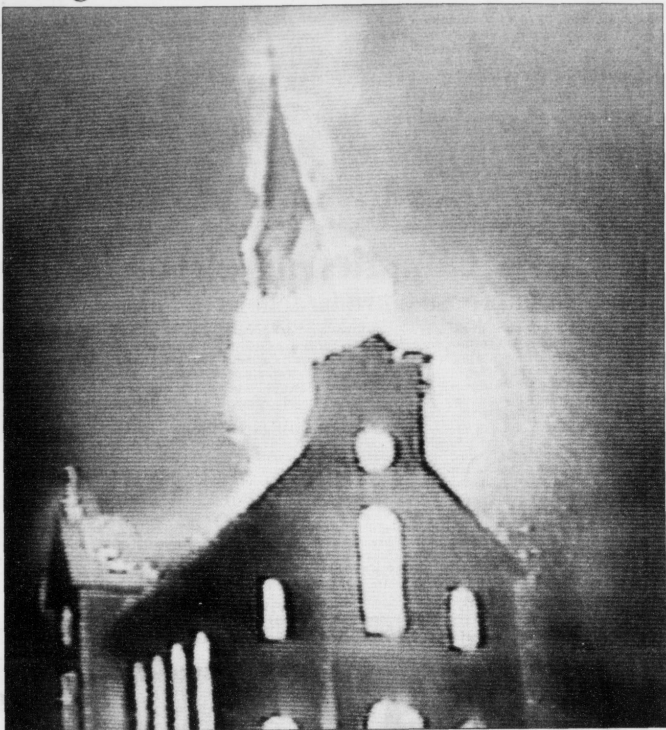
COLLABORATION SPÉCIALE, RAYNALD DION

Cette photo, tirée d'un vidéo amateur, montre la violence de l'incendie qui a complètement détruit l'église de Saint-Luc, dans la région de Matane. Détails en page A 3.