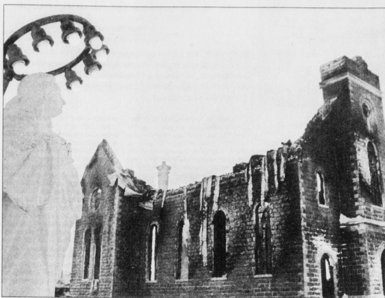
Il ne reste plus que ruines de l'église construite en 1916. La première messe y avait été dite en décembre 1917.