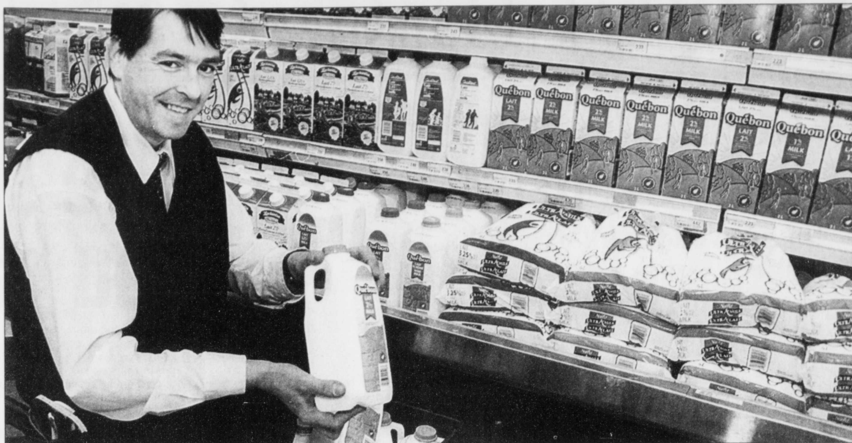
Le contenant de plastique format 2 litres, disponible dans les épiceries depuis la mi-novembre, a été mis en marché dans un but purement marketing, selon Natrel.

Pourtant, selon la directrice des relations publiques, Diane Jubinville, Natrel ne poursuivait pas vraiment de but environnemental. La compagnie cherchait plutôt à « revamp sa gam-