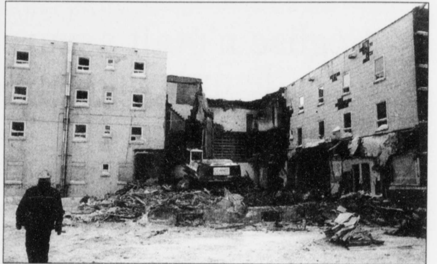
COLLABORATION SPÉCIALE RÉMI SENECHAL

Une partie de l'histoire de Mont-Joli est disparue, jeudi dernier, alors que son plus vieil établissement hôtelier, l'Hotel Commercial, est tombé sous le pic des démolisseurs. L'hôtel, construit en 1881, était rapidement devenu le principal lieu de rencontre sociale des Mont-Joliens, un an seulement après la fondation de la ville. L'établissement de 70 chambres a surtout connu ses heures de gloire pendant les belles années du Canadien National, lors de la Deuxième Guerre mondiale et de la construction des stations radars de la ligne Dew. Mont-Joli était alors la plaque tournante des avions-cargos américains qui, à partir de 1954, se dirigeaient vers le Grand Nord canadien pour y implanter, en pleine guerre froide, cette ligne de défense nord-américaine. Les militaires américains faisaient un arrêt à cet établissement, comme les militaires du Commonwealth qui fréquentaient la 9 e École de bombardiers établie à Mont-Joli. En 1979, l'édifice avait été transformé en un immeuble polyvalent. C.T.