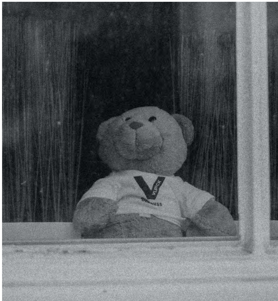
La DPJ peine à répondre à la demande à l'échelle provinciale.