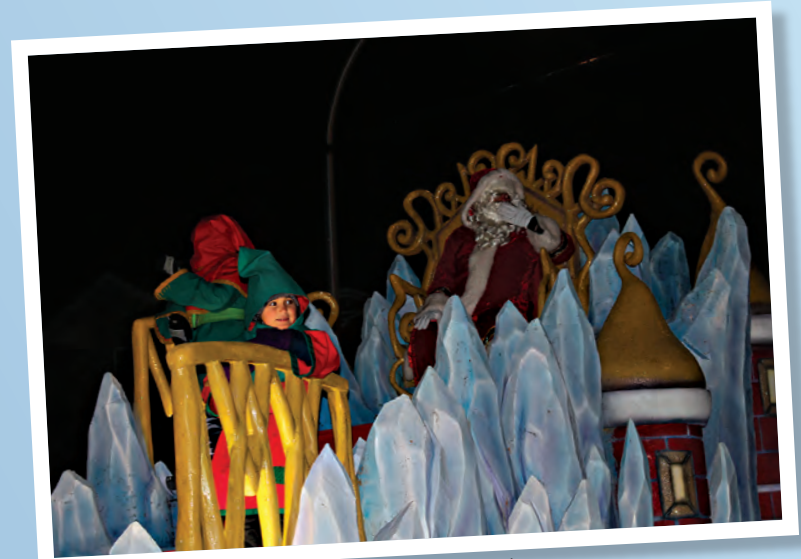
Le père Noël, dans son chariot, clôturait le défilé.