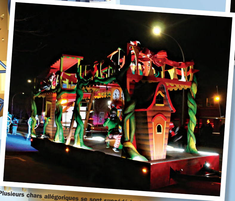
Plusieurs chars allégoriques se sont succédé tout au long de la parade.