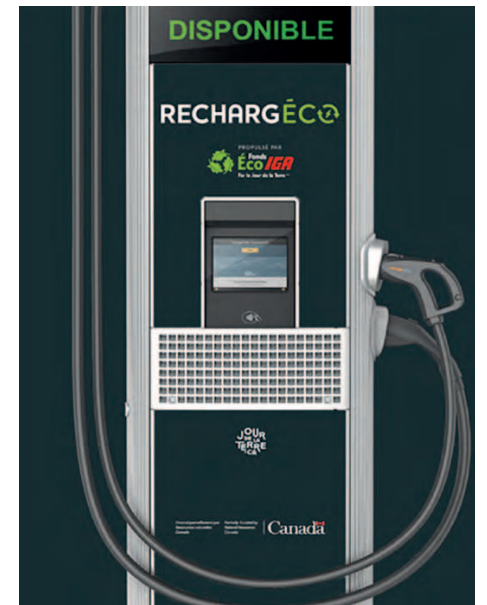
Le Marché IGA Saint-Basile se dote de deux bornes à recharge électrique.

De son côté, le gouvernement provincial a annoncé, il y a trois semaines, vouloir inter-