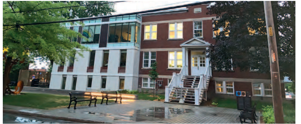
En 2021, les assemblées régulières devraient avoir lieu dans la mairie rénovée et agrandie, mais tout dépend de la pandémie.