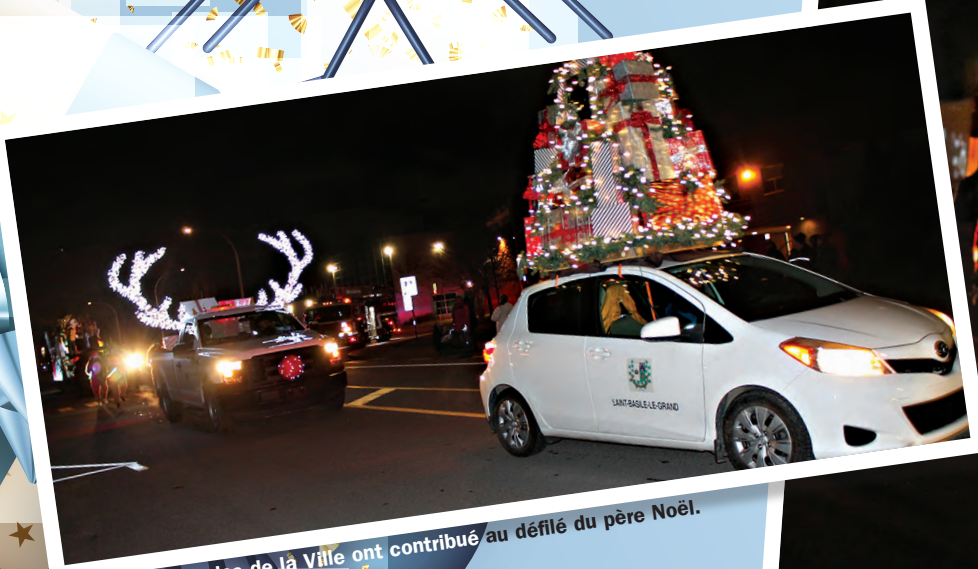
Même les véhicules de la Ville ont contribué au défilé du père Noël.

Le Journal de Saint-Basile était sur place. En voici un aperçu en photos. (Texte et photos : Frank Jr Rodi)