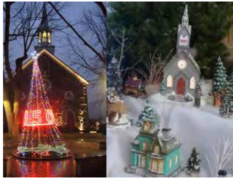
Diverses décorations attractives attendent les visiteurs à la paroisse de Saint-Basile.

Un texte de Chloé-Anne Touma redaction@versants.com