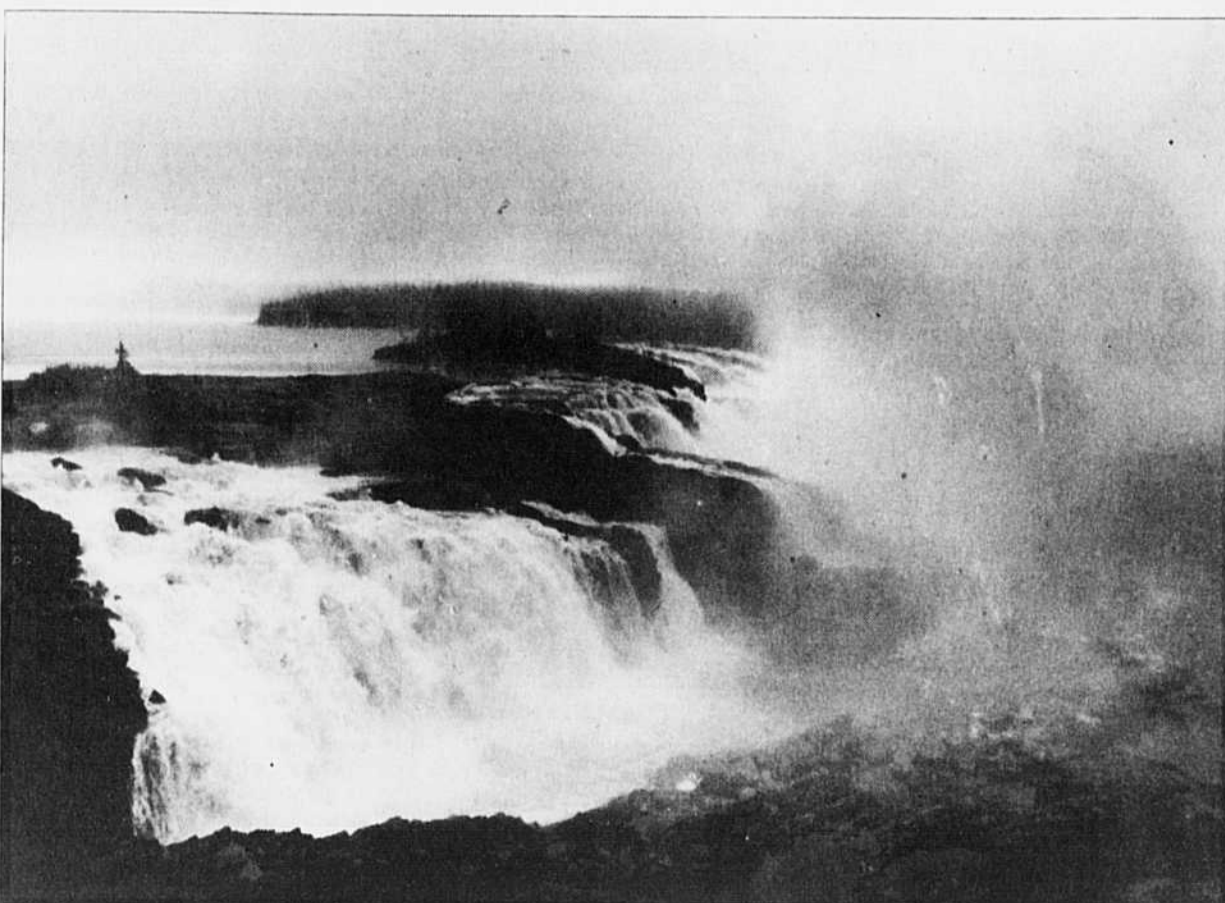
Les chutes de la Grande rivière de la Baleine seront éventuellement détournées vers les turbines du méga-projet de la Baie d'Hudson.

Pour être élue au premier tour, Margaret Thatcher devait obtenir la Voir page A-4: Mme Thatcher