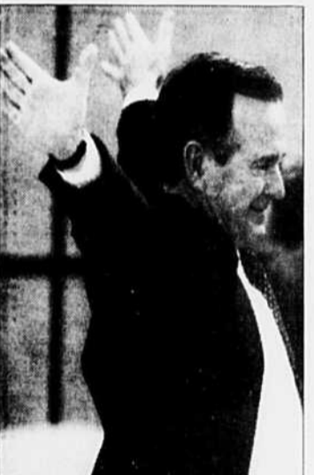
George Bush s'est accordé quelques instants de détente, hier, au sommet de Paris.