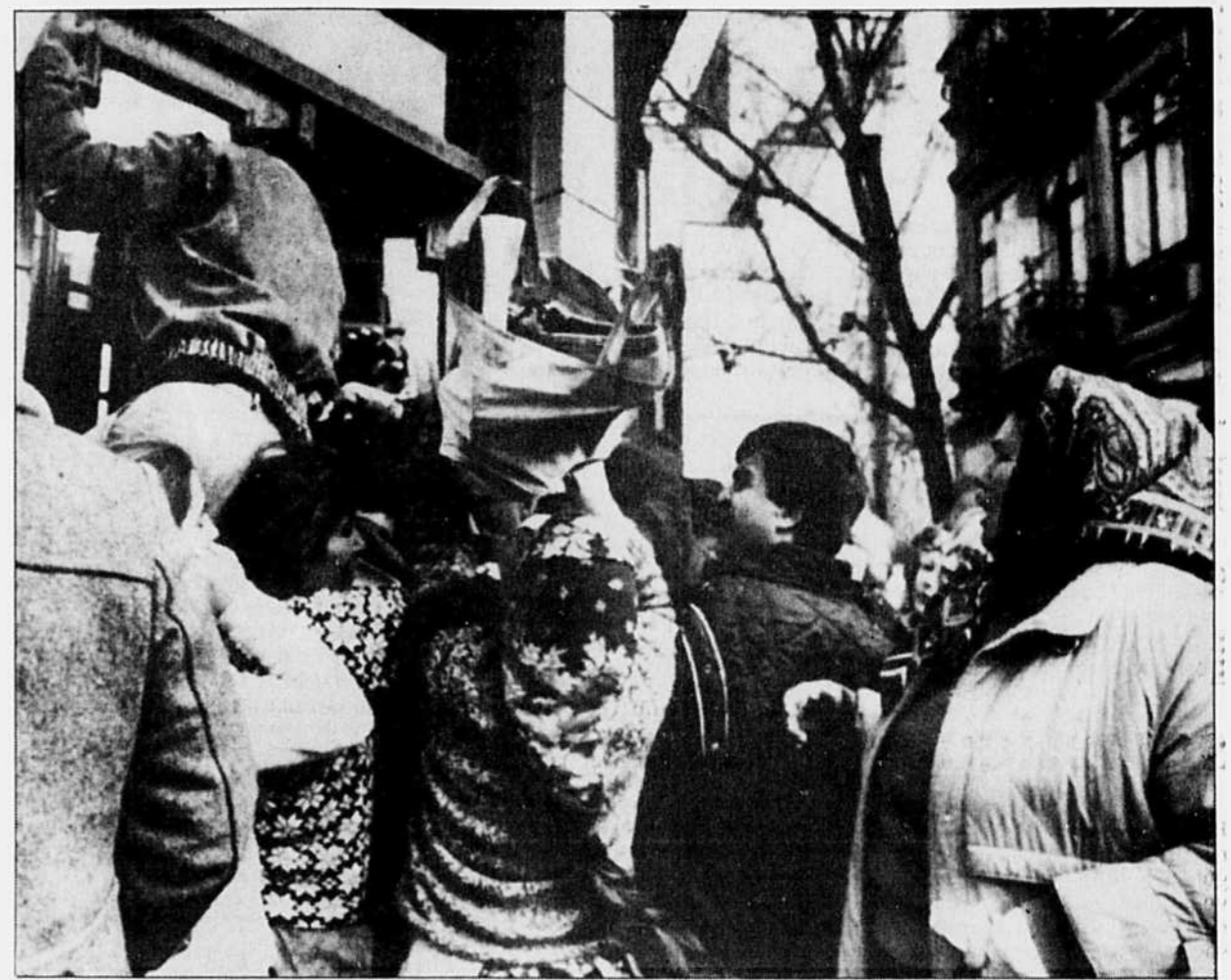
Des Roumains prennent d'assaut un magasin de chaussures à Bucarest. Le nouveau gouvernement n'a pas réussi à mettre fin aux pénuries dans le pays.

Il a reconnu que l'élite du régime communiste de Nicolae Ceausescu, renversé par la révolution de décembre dernier, et les membres de la Securitate, la police secrète, n'ont pas été poursuivis et a indiqué que la justice devaient les condamner.