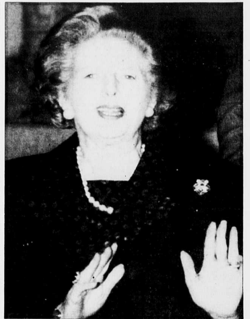
Margaret Thatcher s'est adressée aux journalistes, hier à Paris, quelques heures après avoir été mise en ballottage par Michael Heseltine lors d'un vote pour le leadership du Parti conservateur britannique.