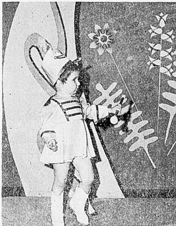
Une "diminutive" majorette de Rivière-du-Loup qui accompagnait le corps féminin de la ville-soeur à une récente émission des talents Co-Op.