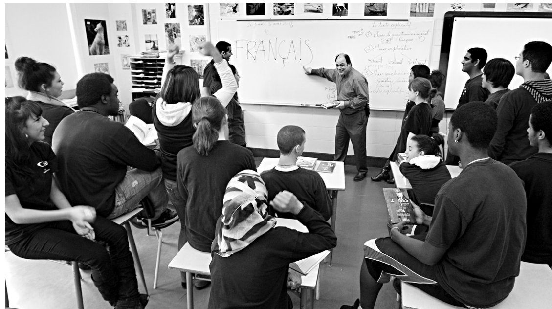
Une classe de l'école secondaire Pierre-Dupuy, à Montréal