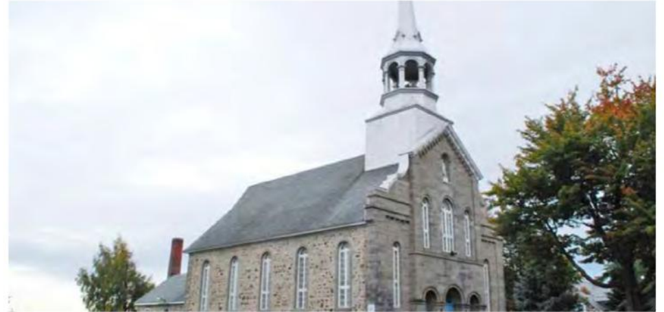
Pascale Floymon purgera 15 mois de prison pour avoir détourné 160 000 $ à la paroisse de Sainte-Angèle-de-Monnoir.

s'était alors aperçu que des fonds avaient été déplacés. La « vis avait été serrée » et Pascale Floymon avait admis sa faute. « Il y a des gens qui ont tellement travaillé à Sainte-Angèle pour avoir cet argent pendant qu'elle, subtilement, vidait les comptes », relate M. Giard.