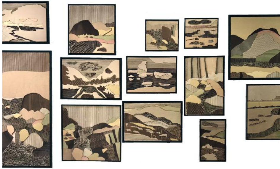
Les œuvres présentées dans le cadre de Seconde nature sont entièrement composées de carton d'emballage recyclé.

En raison de sa nature rigide qui le rend difficile à ciseler, découper ou éplucher, travailler avec le carton peut être contraignant. Pourtant, cette matière s'avère tout autant surprenante, alors que la juxtaposition de différents types de cartons révèle parfois des avenues inattendues. Les différentes teintes dans lesquelles cette matière se