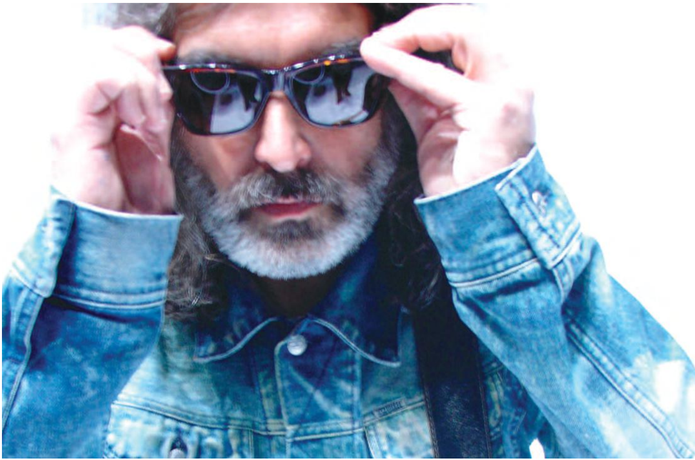
Michel Pagliaro continue de se produire sur scène à 77 ans !

l'innocence se réveille à un moment. Je suis un vieux hippie. J'ai fait beaucoup de fêtes, j'ai vu des gens sombrer dans l'alcool ou les drogues. La vie est difficile dans ces moments-là. La vie dans les arts est compliquée car il existe des périodes durant lesquelles on n'écoute plus personne. Ce sont de grands moments de solitude. Quand l'argent ne rentre pas, tu peux regretter ta job dans laquelle tu t'ennuyais mais qui te garantissait un revenu.