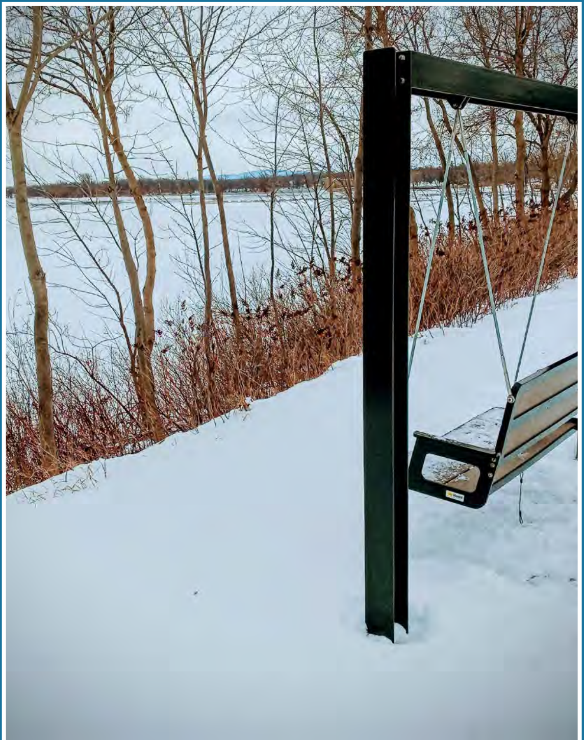
S'arrêter, se poser sur le banc face au bassin et constater que la nature fait bien les choses. En toutes saisons.