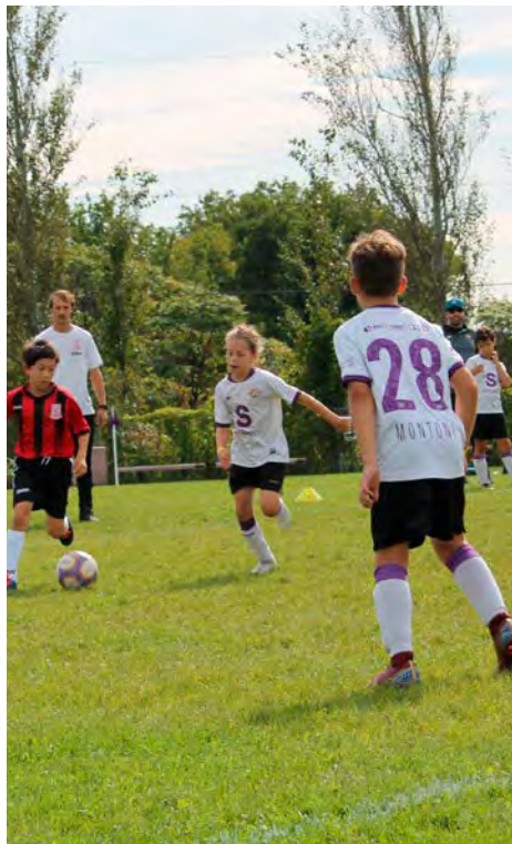
Les comportements déviants sont rares chez les jeunes Québécois.