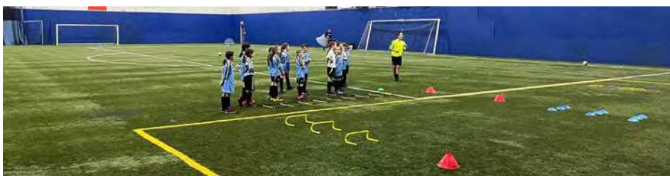
Les joueurs du club encadrent les plus jeunes.

il nous faut un terrain couvert l'hiver. C'est une obligation. » Mais ce n'est pas tout. Le club se structure et le staff s'organise avec des entraîneurs diplômés. « Le ratio entraîneur/joueur est important. Nous comptons suffisamment de coaches actuellement. Certains sont encore jeunes et, ce qui est important pour moi, demeurent des joueurs dans les autres équipes du club. Ils connaissent la réalité du terrain. Le club se charge de les former aussi à l'interne. On veut démontrer ce que l'on sait faire. »