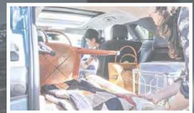
Espace de chargement^^ de 64,5 pieds cubes