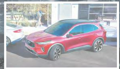
Assistance active au stationnement^ 2.0 en option