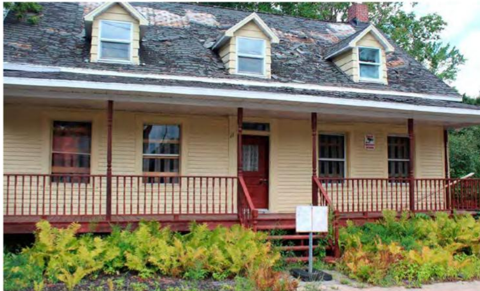
La maison Beauchamp vit certainement ses dernières semaines.

Pour autant, le permis n'a pas encore été délivré au promoteur qui souhaite occuper le terrain. « Le nouveau projet est