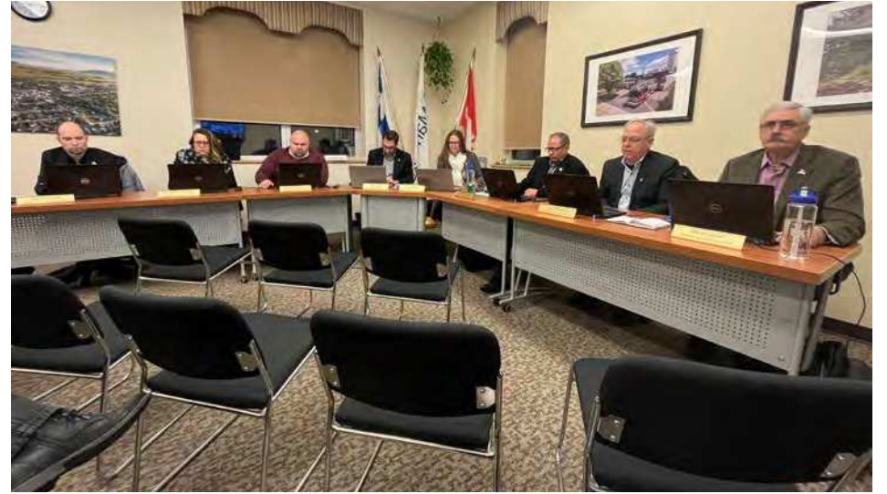
La séance du conseil de Marieville a eu lieu le 17 janvier dernier.

Rappelons que le territoire de la MRC repose sur une épaisse couche de dépôts surtout constituée de schistes argileux et ardoisiers.