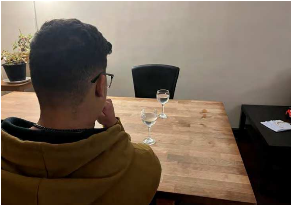
L'âme soeur se trouve-t-elle à l'autre bout de la table ?

Rencontrer l'âme soeur en quelques minutes, est-ce possible ? Sébastien Tremblay en est persuadé et relance la pratique du speed dating , une pratique utilisée avant les sites de rencontre.