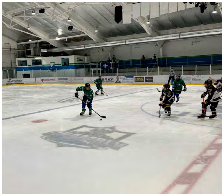
Les coachs de hockey réalisent beaucoup de prévention concernant l'alimentation des jeunes.

Le dirigeant chamblyen est confiant concernant la discipline de ses jeunes et de l'environnement sécuritaire que propose le hockey. « Les joueurs sont souvent testés. On ne peut pas jouer avec la santé. Un naturopathe nous aide régulièrement pour que les jeunes puissent suivre un régime en accord avec la compétition. Des programmes fédéraux existent aussi pour aider les jeunes en cas de dérapage. »