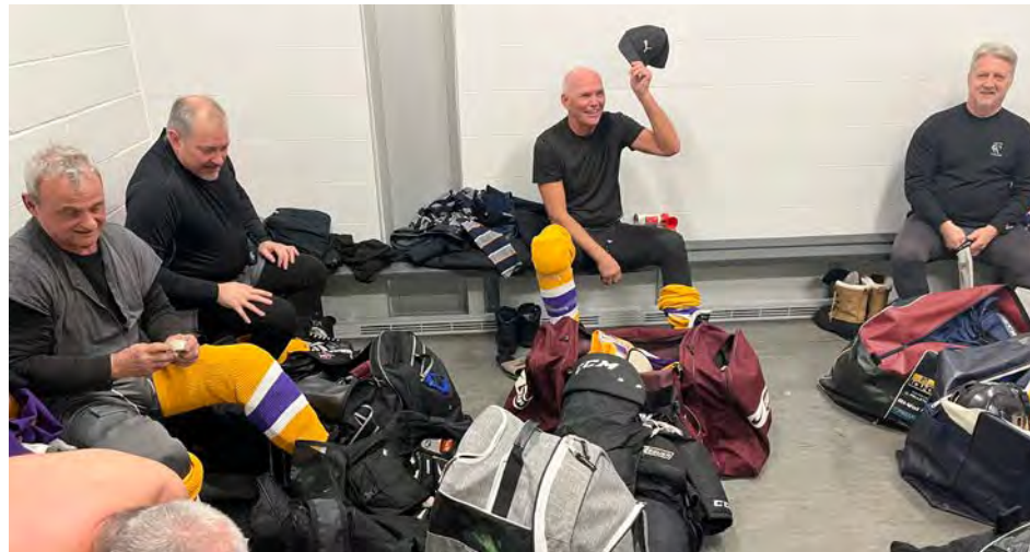
La Ligue de hockey les Vétérans de Chambly souligne ses 50 années d'existence.

Aux antipodes, la majorité des ligues ont également le joueur qui traîne de la