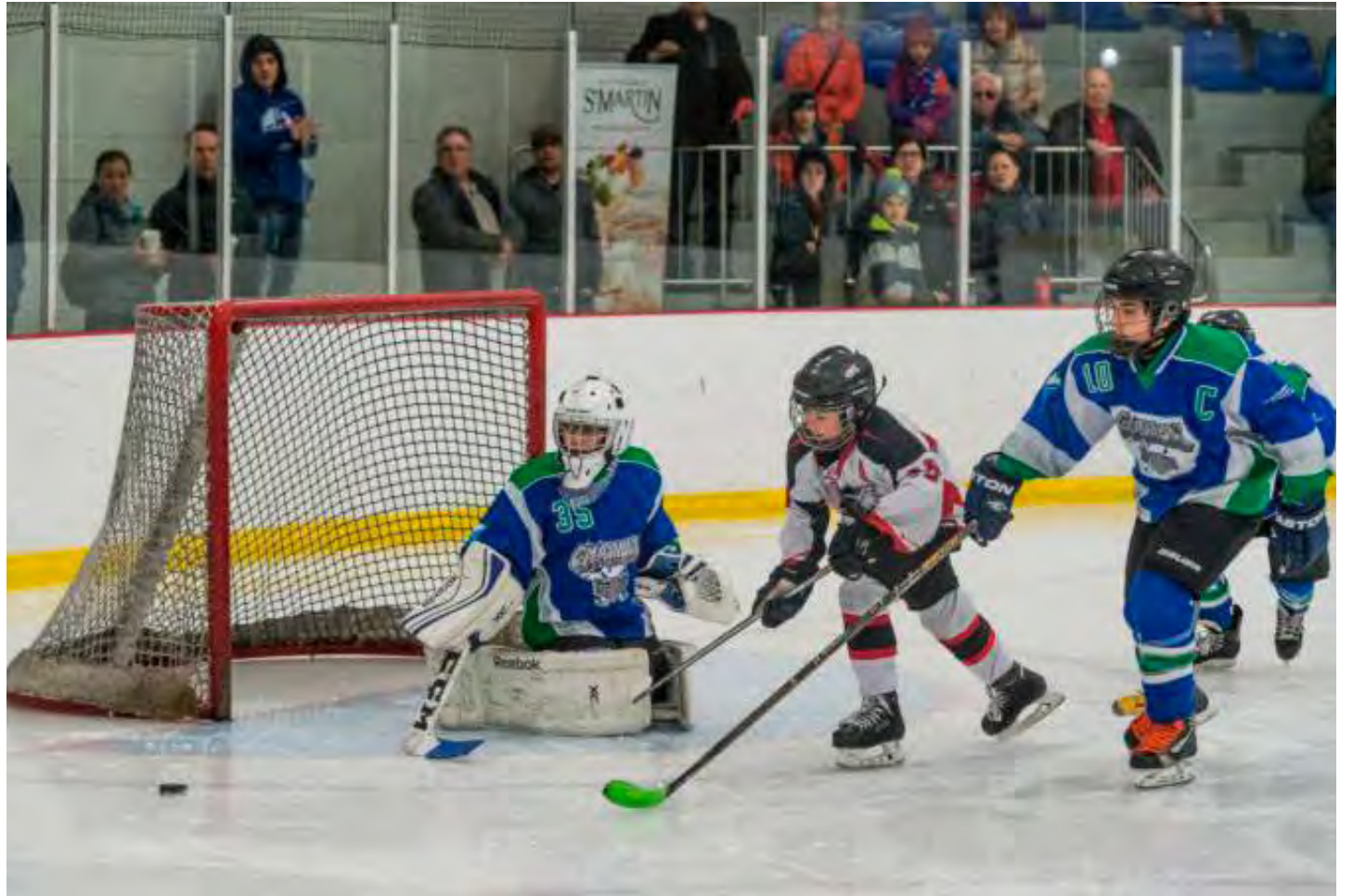
Hockey Québec a décidé de ne plus envoyer à Hockey Canada les 3 $ par frais d'inscription de ses quelque 80 000 joueurs.

six dernières années. » Selon le technicien, les comportements déviants des jeunes sont le fruit de ceux des joueurs adultes. « Des joueurs de LNH consommaient de la moutarde pour éviter des crampes. Parfois, des croyances ou des méthodes viennent d'un phénomène de mode. Certains adultes prennent du cannabis avant une pratique. Nous sommes assez vigilants de ce côté-là car les jeunes copient leurs aînés. Il m'était arrivé de retrouver des sachets de moutarde dans le vestiaire. Donc je ne suis pas forcément inquiet sur la mentalité des jeunes hockeyeurs : c'est