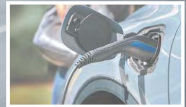
Motorisation hybride et hybride rechargeable en option