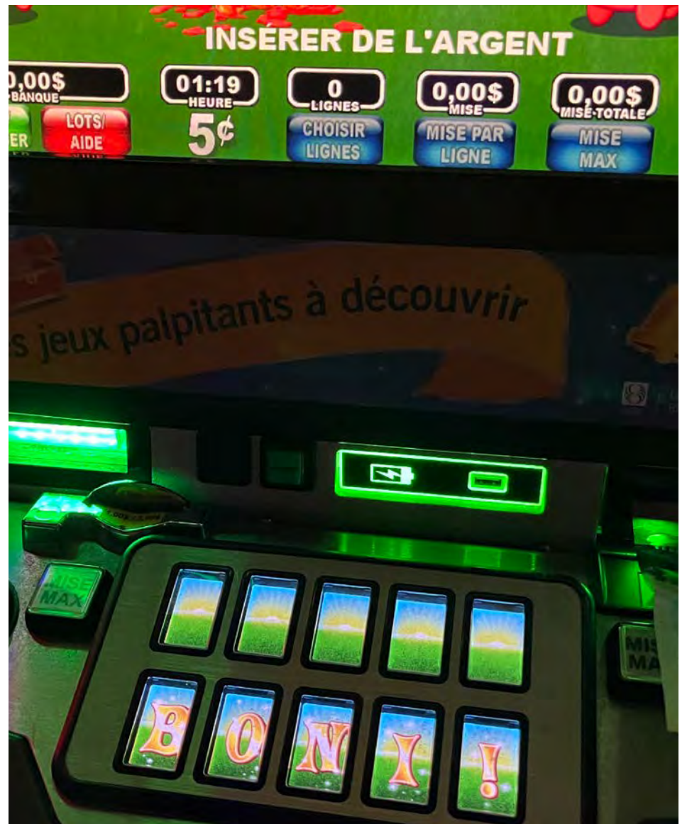
Jean-Sébastien a frôlé la prison en raison de son addiction au jeu.

Jean-Sébastien ne joue plus depuis plusieurs années maintenant, mais considère que le combat demeure quotidien. Pour aider les joueurs, un groupe de GA