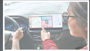
Écran de 13,2 po en option