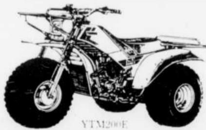
Il n'y a qu'un seul mot pour décrire une trois roues: TRI-MOTO

Pour aller dans les endroits impraticables.