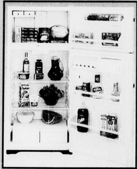
RÉFRIGÉRATEUR 15 pi cu.

POUR LA QUALITÉ! POUR LE SERVICE! POUR LES PRIX!