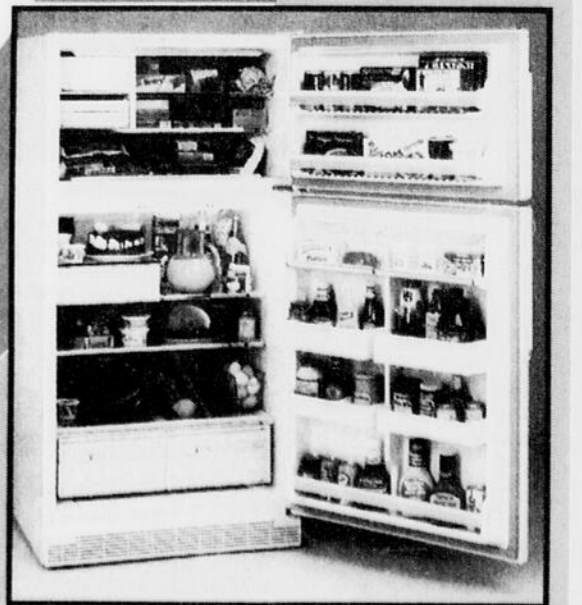
RÉFRIGÉRATEUR Inqlis 18 pi cu. 799$