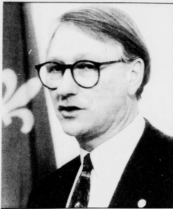
Gérald Tremblay, ministre de l'Industrie et de tutelle de la SAQ

Néanmoins, affirme le ministre de tutelle de la SAQ, Gérald Tremblay, cet accord prouve qu'il est possible de signer un contrat social dans les paramètres fixés par le Conseil du Trésor.