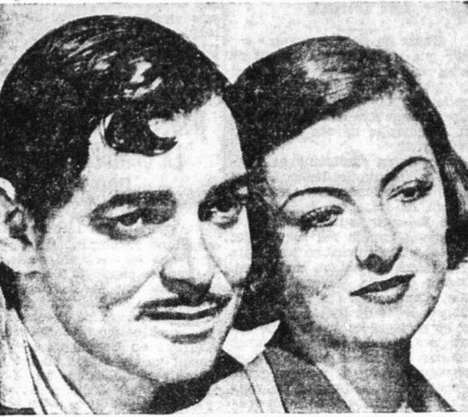
CLARK GABLE et MYRNA LOY, les vedettes de "Too Hot to Handle" que le Capitol jouera les quatre premiers jours de la semaine.