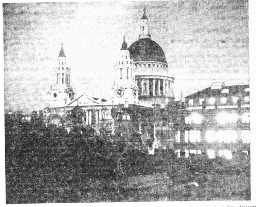
Le photographe du "Times", Londres, parcourt actuellement l'Angleterre, photographiant les différentes cathédrales par les nuits de pleine lune. Cette photo nous montre la cathédrale de St-Paul, Londres.