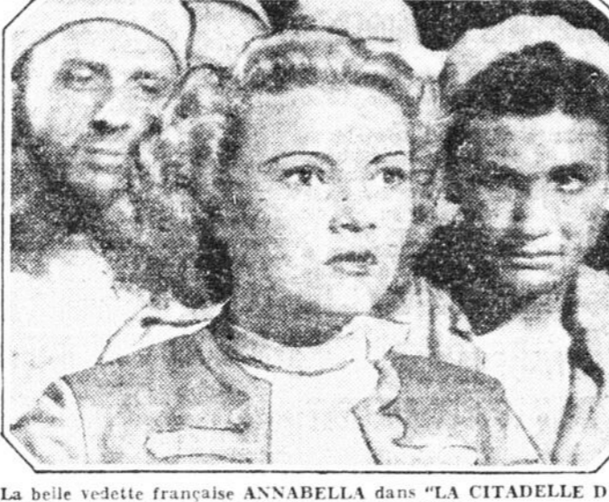
La belle vedette française ANNABELLA dans "LA CITADELLE DU SILENCE" aujourd'hui jusqu'à mardi au cinéma Rialto.