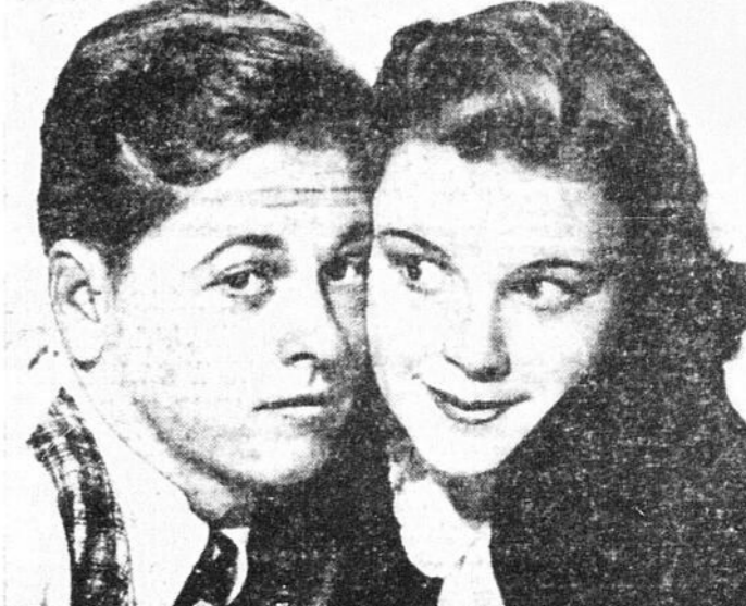
MICKEY ROONEY et JUDY GARLAND dans "Love Finds Andy Hardy", le plus nouvelle et la meilleure des aventures de la famille du juge Hardy, actuellement à l'écran du cinéma Cartier.