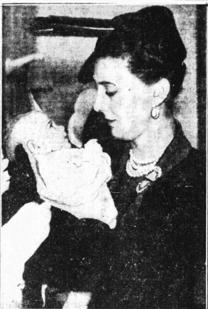
Les mains d'une nurse — qui ne veut pas prendre de chances — hésitent à quitter le marmot que la duchesse de Kent vient de prendre dans ses bras, lors d'une récente visite à l'hôpital Rochford, Essex.