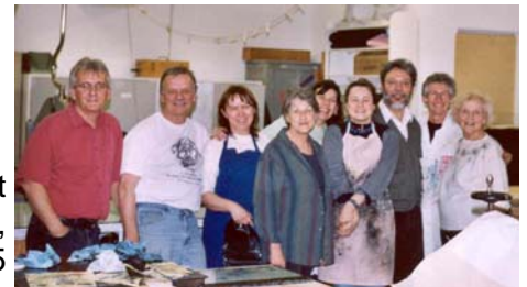
Formation en photo-gravure tenue à l'Atelier les Mille Feuilles du 9 au 12 avril 2003

Avec le service de développement professionnel du Conseil de la culture et grâce au soutien financier d'Emploi-Québec, ce sont 138 artistes, travailleuses et travailleurs culturels de la région qui ont bénéficié de 15 activités de formation et de perfectionnement offertes entre le 18 janvier et le 8 juin 2003.