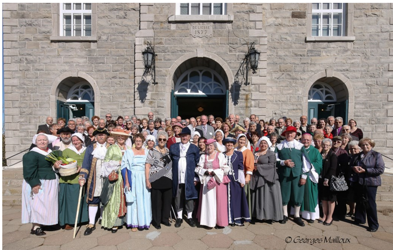
Les Filles du Roi et la Société historique de la Côte-du-Sud à La Pocatière, Québec / The Daughters of the King and the Historic Society of the Côte-du-Sud at La Pocatière, Québec