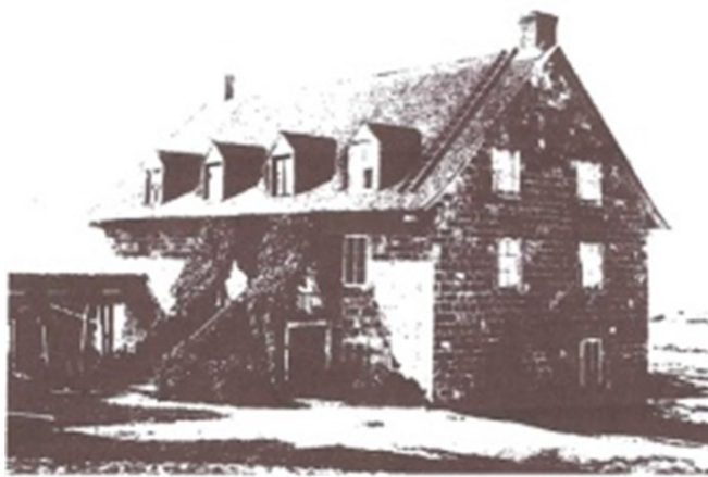
Le moulin banal du ruisseau à la Loutre datant du milieu du XIXe siècle, en 1850 (A.N.Q. no 974-144). /

The mill housed the mechanism for grinding grain and for the lodging of the mill operator. In the garden you can see the great millstone used to grind the grain. This mill was powered by the Loutre stream.