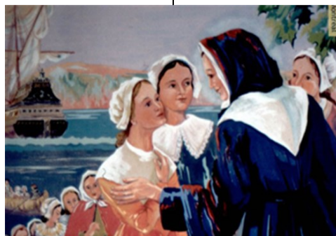
Arrivée des filles du Roy / Arrival of King's daughters