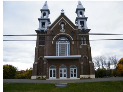
Église François-Xavier à Charlo, N.B.