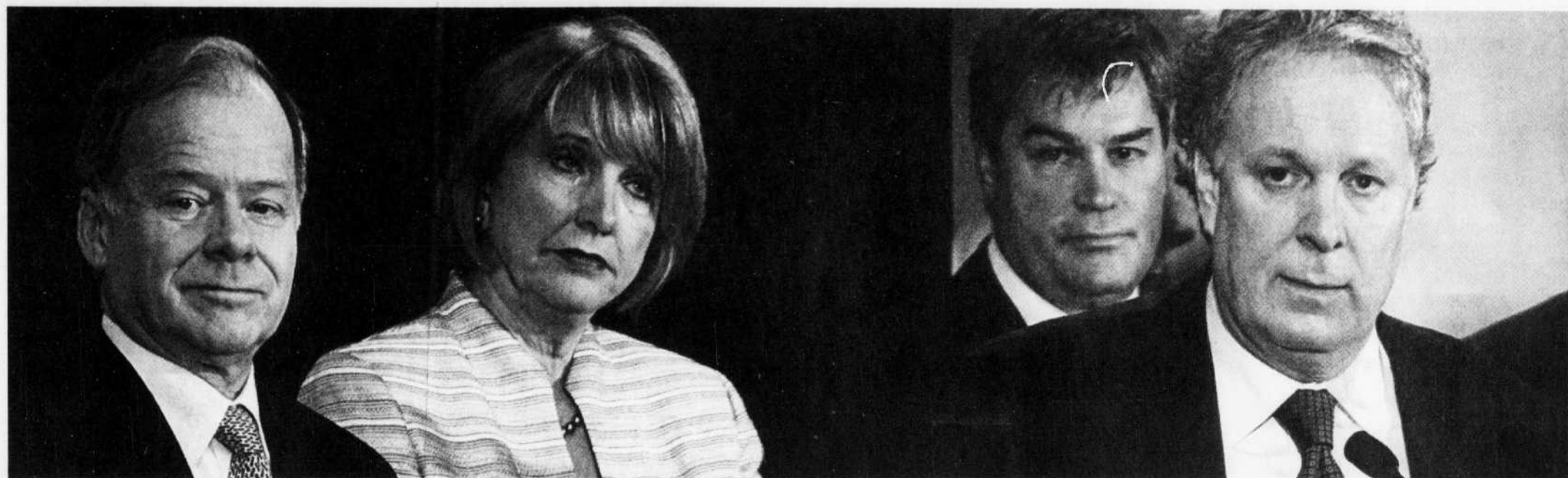
Le premier ministre Jean Charest entouré des ministres Raymond Bachand, Monique Jérôme-Forget et Yves Bolduc pour annoncer le lancement de l'appel d'offres pour le CHUM, hier, à Montréal.

■ Chrysler et GM sont encore trop optimistes, page B 1 ■ Coup de frein à la Bourse, page B 1 ■ L'éditorial de Jean-Robert Sansfaçon, page A 6