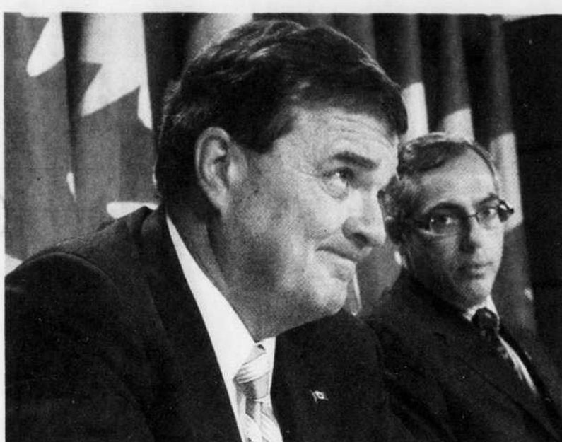
Le ministre des Finances, Jim Flaherty, et le ministre de l'Industrie, Tony Clement, ont répété à Ottawa les mêmes demandes à l'égard des constructeurs automobiles que celles formulées hier à Washington.

Ottawa, a ajouté M. Clement, a eu à se demander s'il était souhaitable de voir une compagnie Chrysler s'enfoncer dans une « faillite désordonnée ». « Puisque nous leur avions fait une proposition de prêt, et compte tenu du fait qu'ils n'auraient pas pu verser les salaires, nous avons senti qu'il était