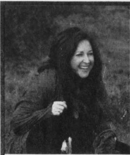
Laurence Jalbert , auteure-compositrice-interprète porte-parole de la Francofête 2009