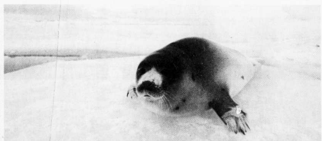
Un phoque sur la banquise du golfe du Saint-Laurent. Des scientifiques grecs espèrent bientôt pouvoir greffer sur des humains des valves aortiques et des trachées prélevées sur des phoques.

Un premier responsable khmer rouge est jugé ■ À lire en page B 5