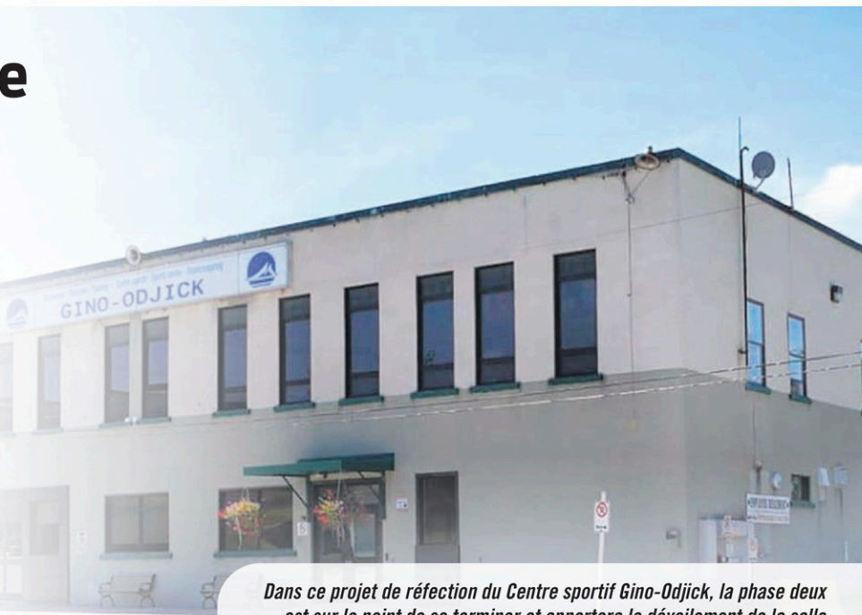
Dans ce projet de réfection du Centre sportif Gino-Odjick, la phase deux est sur le point de se terminer et apportera le dévoilement de la salle communautaire, à l'étage, en septembre.

La mairesse a aussi raconté que la Ville avait fait une première demande d'aide financière qui n'a pas été acceptée, car à ce moment les enveloppes étaient très minces et que l'argent avait été accordé à des projets de petite envergure. « À ce moment, on a décidé de séparer la phase trois en projets, ce qui nous offre plus de possibilités pour faire différentes demandes dans différents programmes.