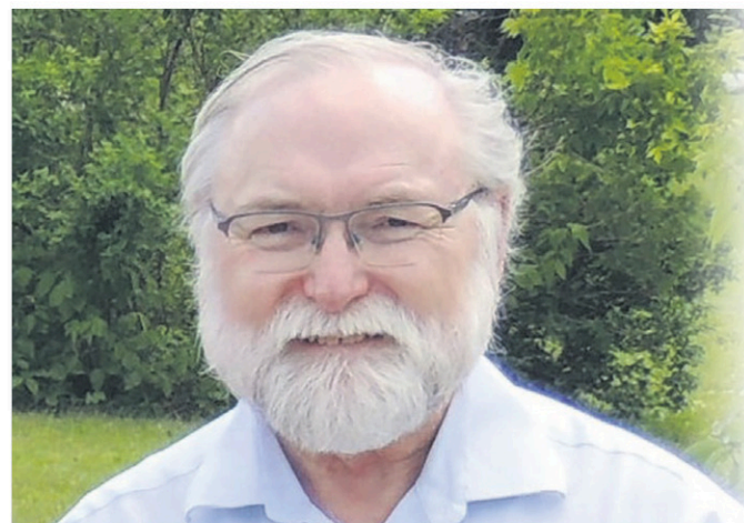
Les projets soutenus, qui permettront à la population de profiter sécuritairement de la nature, visent notamment des sentiers pédestres, équestres et de vélo de montagne, des pistes cyclables, des pistes de ski de fond ainsi que des aires d'escalade.

SALLE DE RÉDACTION redaction@inmedias.ca