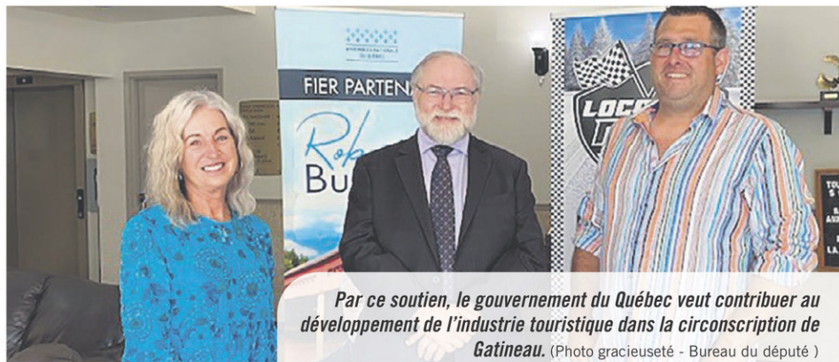
Par ce soutien, le gouvernement du Québec veut contribuer au développement de l'industrie touristique dans la circonscription de Gatineau.

SALLE DE RÉDACTION redaction@inmedias.ca