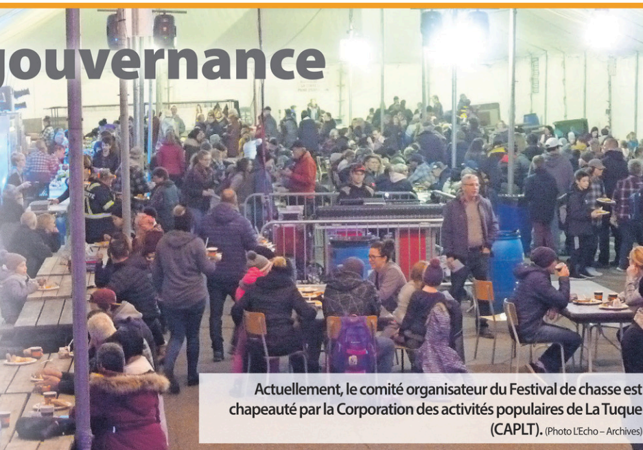
Actuellement, le comité organisateur du Festival de chasse est chapeauté par la Corporation des activités populaires de La Tuque (CAPLT).

Tendues, les relations entre la Ville et le Festival de chasse ? « Je n'irais pas jusque-là (...) C'est dans le but de corriger cette situation ».