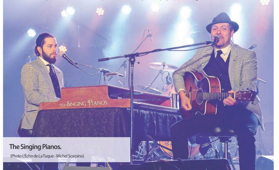
The Singing Pianos.

Les organismes devraient recevoir une invitation officielle pour cette soirée avec toutes les informations nécessaires pour réserver jusqu'à 6 billets pour leurs bénévoles après quoi, s'il en reste, ils seront disponibles pour la population en général.