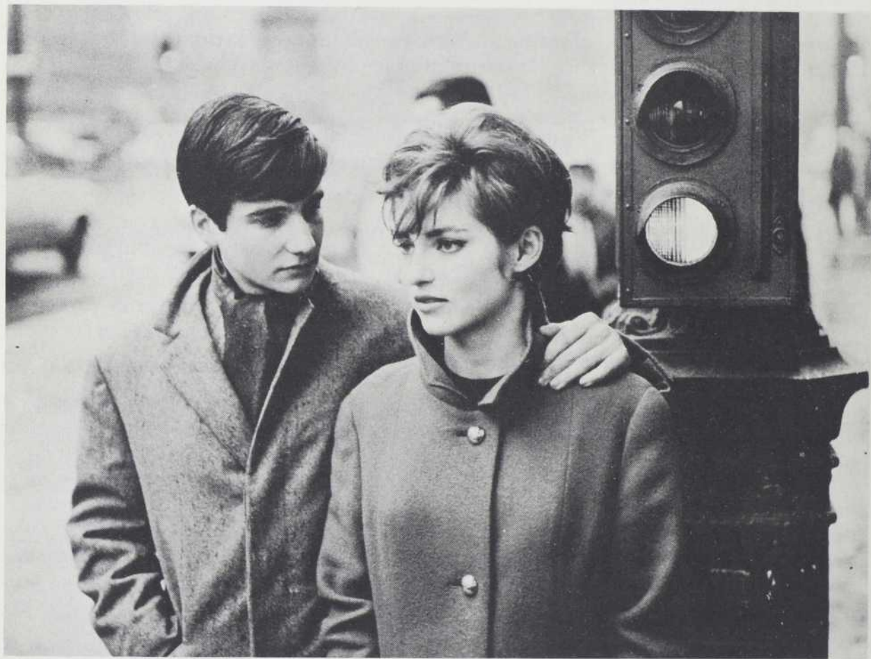
L'AMOUR A VINGT ANS, épisode français

faite de tragédies cruelles qui proviennent précisément du drame ambigu ou, pourrions-nous dire, du jeu faussement tragique de l'adolescence. Du reste, c'est la première fois qu'il met en scène des adolescents ( Les Mistons étaient des pré-adolescents). Le drame des personnages de Truffaut ne serait-il pas le suivant, à savoir qu'enfants ils essaient de devenir trop vite adultes (Antoine a été obligé de le faire) et qu'adultes ils voudraient vivre comme des enfants ( Jules et Jim est une ronde enfantine qui, jusque dans la mort, garde un air de profonde nostalgie, très proustienne d'ailleurs).