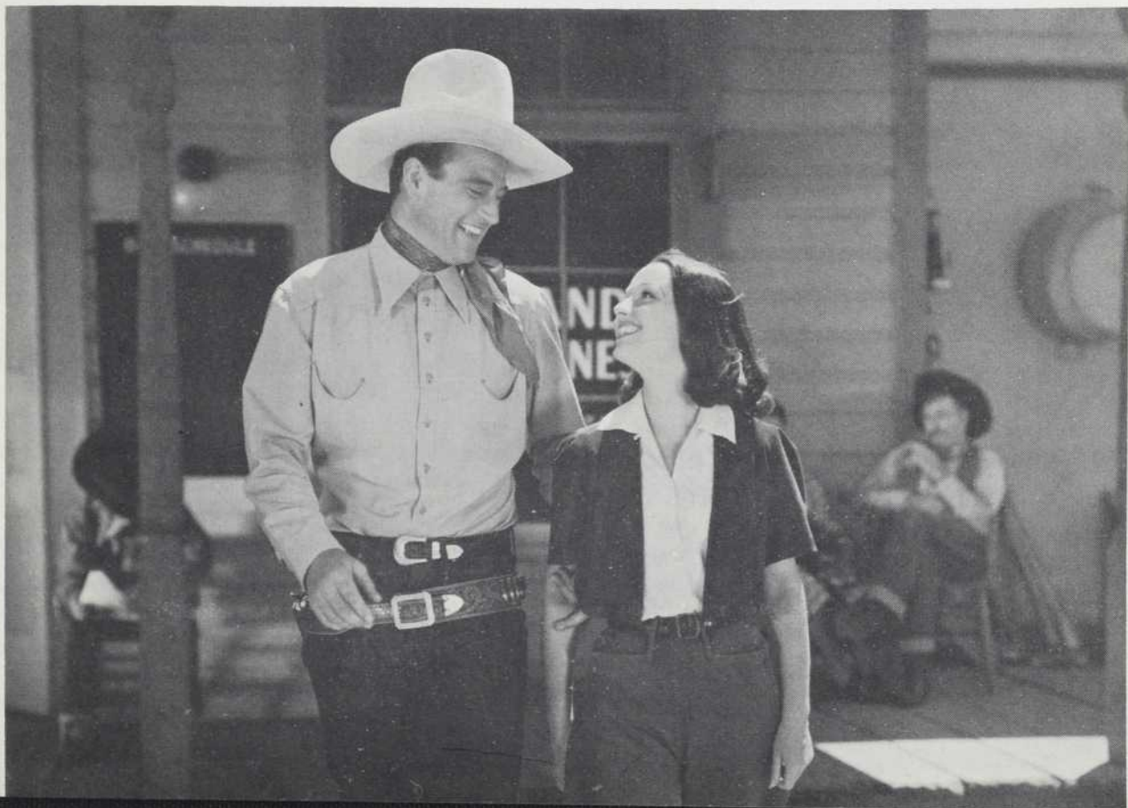
Louise Brooks et John Wayne dans OVERLAND STAGE RAIDERS

En Allemagne, c'était merveilleux. On n'avait pas autant d'argent à dépenser qu'à Hollywood et les gens connaissaient mieux leur métier qu'aux États-Unis, surtout le caméraman et l'assistant-réalisateur. Ce dernier, à Hollywood, était un homme à tout faire, et l'une de ses principales fonctions consistait à conserver le nom de jolies filles « supplémentaires » pour répondre aux appels du producteur ou du réalisateur quand ils donnaient des parties .