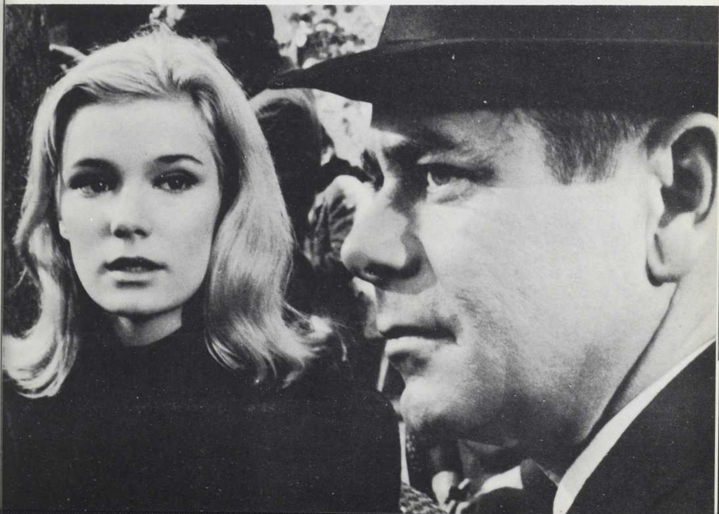
Glenn Ford et Yvette Mimieux dans THE FOUR HORSEMEN OF THE APOCALYPSE

Mais en général tout film de Minnelli met en scène le conflit entre ces deux rêves, ces deux décors humains : la société et l'être intime. Voyez, entre autres, Gigi : d'un être spontané, quasi animal, on veut faire une demi-mondaine qui puisse s'intégrer dans la société fin de siècle parisienne jusqu'au moment où