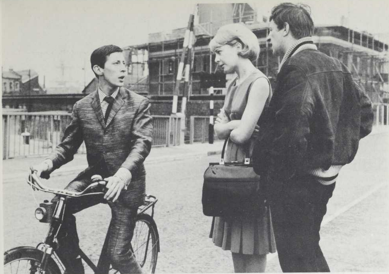
SPARROWS CAN'T SING de Joan Littlewood