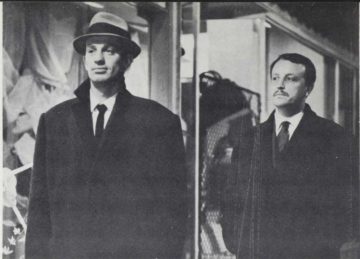
LE DOULOS de Jean-Pierre Melville

admirable point de coupe, la caméra revient sur Maurice et le coup de feu est tiré. Beaucoup plus tard, Maurice dira qu'il n'aurait jamais pu tirer si Gilbert ne s'était pas retourné. Tout le meurtre est ainsi expliqué dans ses motivations ultimes par un simple champ-contrechamp, une action et une réaction.