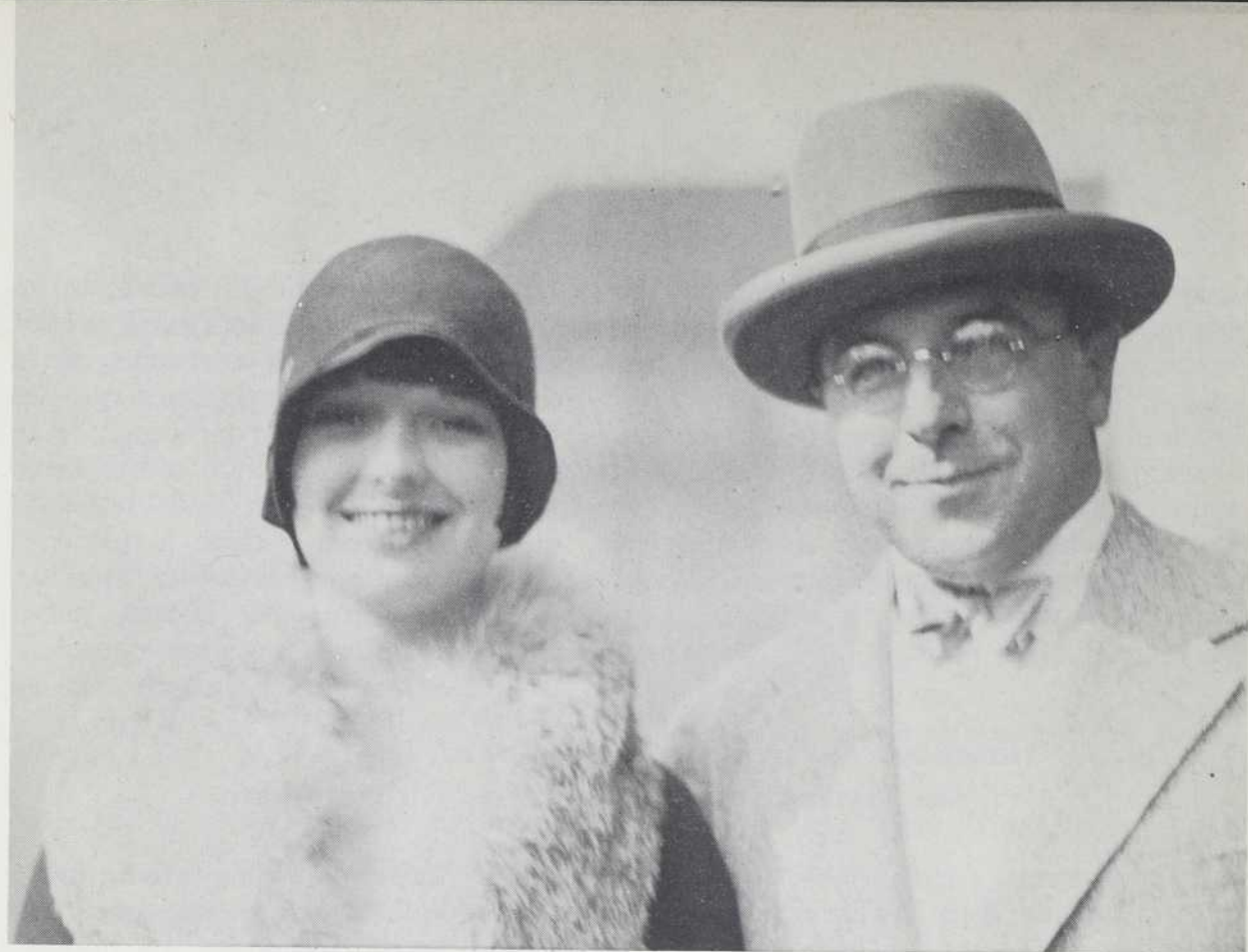
Louise Brooks et G. W. Pabst