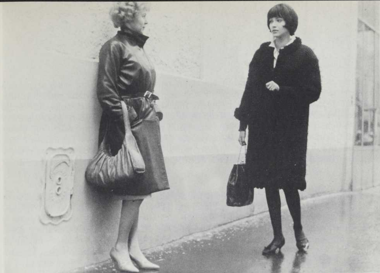
VIVRE SA VIE de Jean-Luc Godard