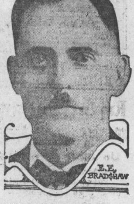
Les pilules végétales Tanlac recommandées par les fabricants de Tanlac.

Ce Torontonien était à la veille d'un épuisement nerveux lorsqu'il a pris Tanlac