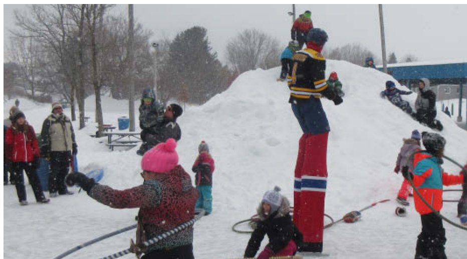
Près de 500 personnes ont participé, dimanche, à la 8 e Féerie des neiges d'Acton Vale.

« Cette activité se veut une occasion de faire sortir dehors les familles pour profiter des joies de l'hiver. Nous pouvons dire, encore cette année, mission accomplie », affirme Mme Lessard.