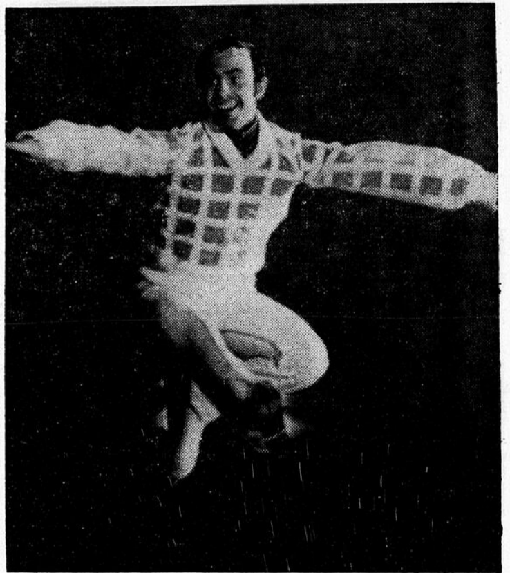
Champion du monde à deux reprises, Tim Wood le Dé-troit, fait actuellement ses débuts professionnels avec les "Ice Capades '71" et on pourra l'applaudir au Forum de Montréal avec une toute nouvelle édition du 10 au 15 novembre.

qui nous assure de meilleurs lendemains.