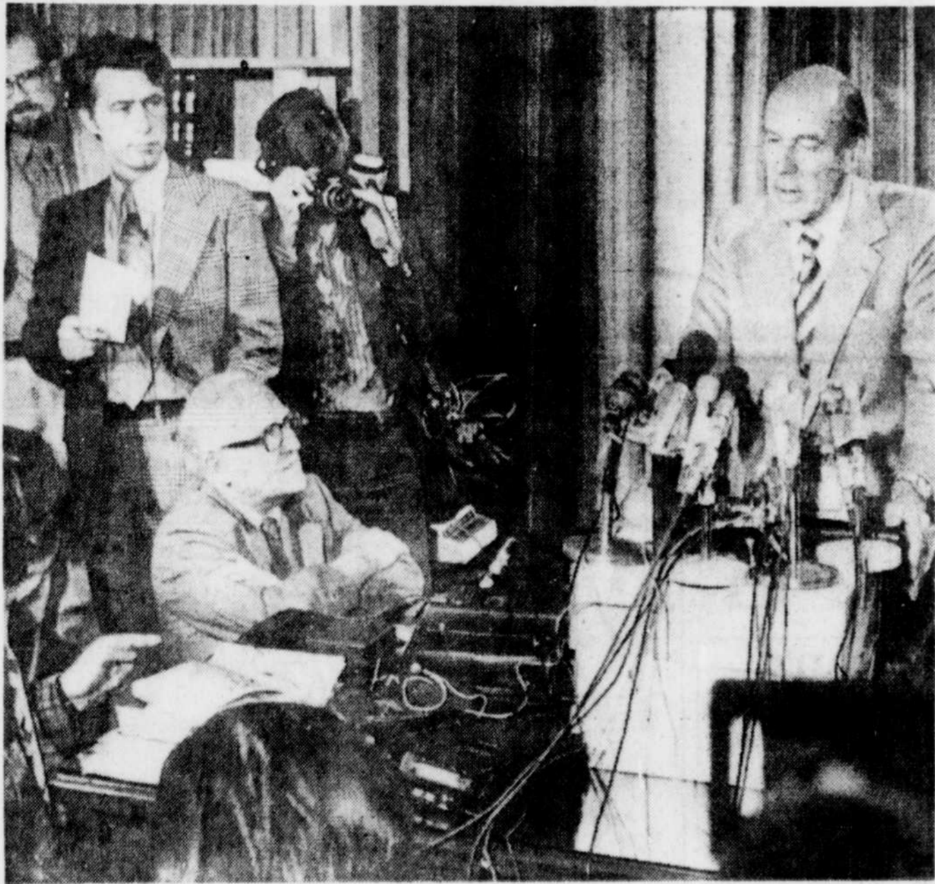
La course au leadership dans les rangs conservateurs... après l'annonce faite hier par M. Stanfield, au cours d'une conférence de presse, qu'il abandonnera la vie politique d'ici deux ans... et la direction du parti en même temps... si le parti ne le pousse pas dehors avant