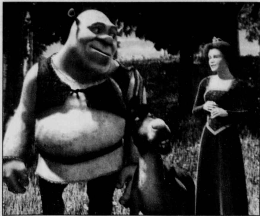
Pendant leur voyage pour délivrer et emmener Fiona au château de Lord Farquaad, l'âne et Shrek découvrent une princesse pas comme les autres.

Une bonne portion des gags sont destinés aux adultes, exclusivement.